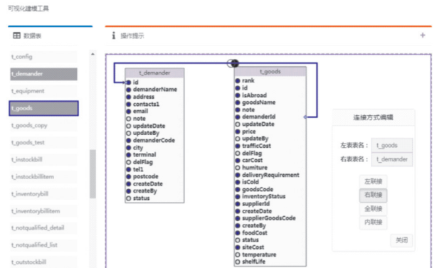
图 2 可视化数据源建模工具