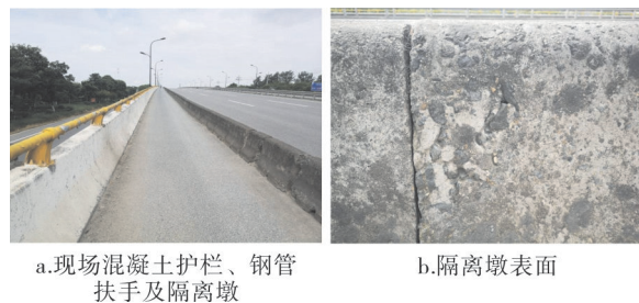
图2 施工前桥面混凝土结构表面状态

针对混凝土结构表面碳化松软甚至脱落问题,经设计人员现场踏勘,确定放弃对隔离墩的涂装维护。桥梁护栏混凝土结构表面相对坚实,去除表面爬藤、旧涂层及表面碳化层后,采用混凝土专用强固剂处理,然后再进行涂装维修作业。修改的方案经现场验证可行后予以实施,并取得较好的维修效果(见图3)。