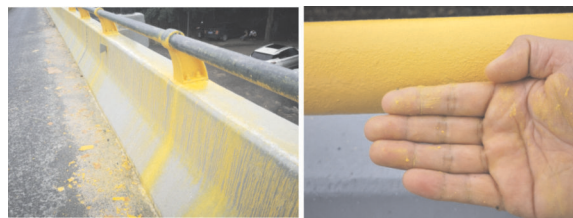
图4 突发暴雨对涂后不久水性涂料的破坏

鉴于夏季阵雨的不确定性,施工过程中发现水性丙烯酸聚氨酯面漆出现涂装后不久(但超过4 h)被阵雨冲刷脱落的问题(见图4),项目部立即向涂料供应方反映,涂料厂及时派出技术专家,一起分析问题原因,查证是水性涂料涂装后需要24 h甚至7 d的有效养护期(设计文件要求不小于4 h),才能形成可靠的涂层质量。针对此次雨水冲刷问题,项目部进一步加强了天气信息的及时掌控,确保水性涂料涂装后有足够的养护时间,防止类似问题发生。