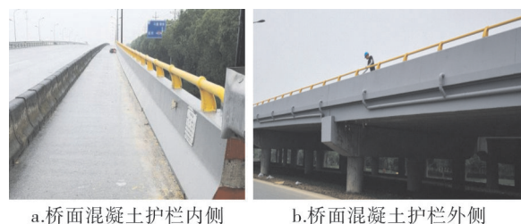
图3 桥面混凝土护栏涂装维修后效果

针对混凝土结构表面碳化松软甚至脱落问题,经设计人员现场踏勘,确定放弃对隔离墩的涂装维护。桥梁护栏混凝土结构表面相对坚实,去除表面爬藤、旧涂层及表面碳化层后,采用混凝土专用强固剂处理,然后再进行涂装维修作业。修改的方案经现场验证可行后予以实施,并取得较好的维修效果(见图3)。