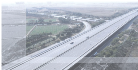
图 1 严家埭立交桥全貌

桥跨和其两侧各一跨桥墩盖梁墩柱、梁板、桥底等混凝土外表面和全桥护栏外侧、桥梁护栏内侧混凝土外表面,以及梁底混凝土结构接缝密封涂装(主跨及边跨部分);钢结构防腐涂装部分主要是桥面栏上钢管扶手表面,具体防腐涂装方案设计见表 1 [3] 。