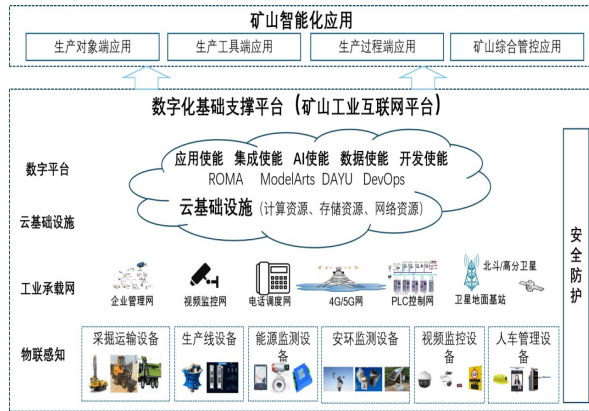
图2 露天矿数字化基础支撑平台架构

平台,是矿山实现智能化、自动化、高效化生产的重要支撑,它涵盖了物联感知、工业承载网络、云基础设施、数字平台、安全防护等多个方面。露天矿数字化基础支撑平台架构如图2所示,该架构通过集成物联网、大数据、云计算、人工智能等先进技术,统一架构、统一标准、统一数据规范,将ICT技术与矿山业务流深度融合,实现对矿山信息的感知汇聚、数据融合共享、资源优化配置与价值发掘。