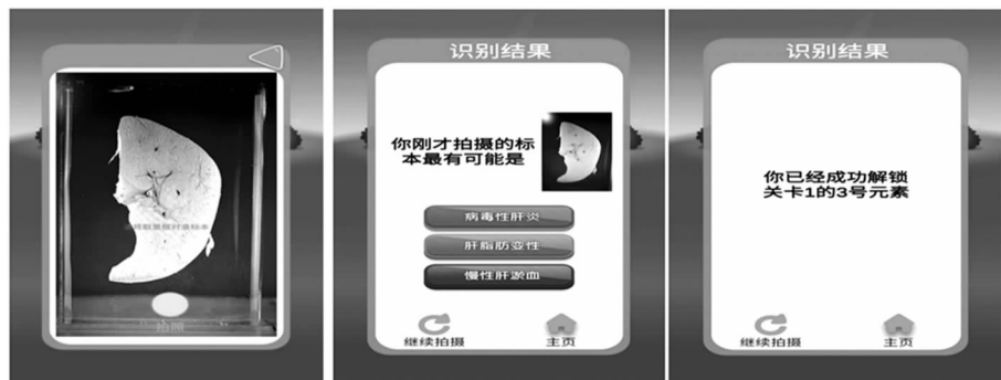
图10 拍照实验用病理器官标本上传 图11 比对确认 图12 解锁关卡