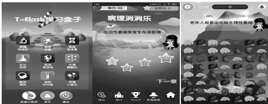
图1 T-Flash学习软件主界面 图2 病理消消乐主界面 图3 关卡奇数关大体器官标本