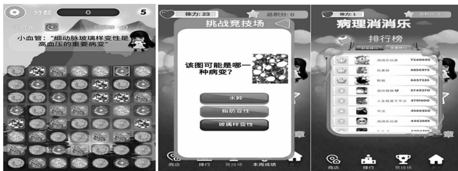
图4 关卡偶数关组织切片标本 图5 挑战竞技场 图6 积分排行榜