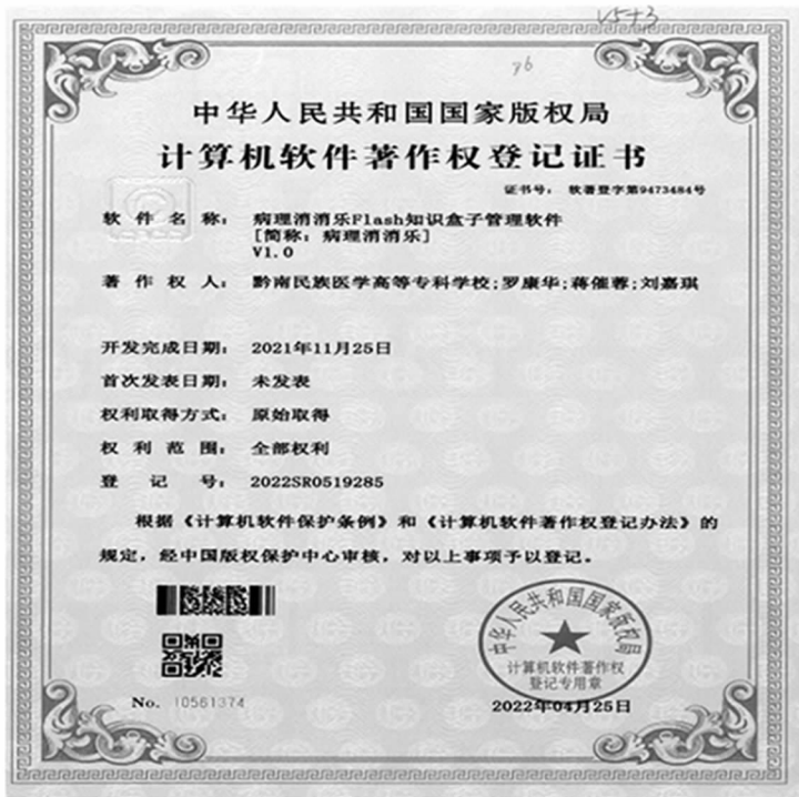
图 13 病理消消乐 flash 知识盒子管理软件

2.1 已研发出手机端 T-Flash 软件测试 v1.0 版并完成内测。申请授权软件著作权（图 13）。