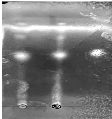
1 号点为样品 1；2 号点为样品 2；3 号点为菝葜皂苷元对照品

菝葜皂苷元对照品，甲醇配制成每 1 ml 含 0.5 mg 的溶液，得对照品溶液。照薄层色谱法（中国药典 2020 年版四部通则 0502）试验，分别吸取上述 2 种溶液各 5 μl，点于同一硅胶 G 薄层板，以三氯甲烷-丙酮（95:5）作展开剂展开，取出晾干，喷 10% 硫酸乙醇溶液，加热至斑点显色清晰，在 105℃ 灯下观察，供试品色谱在与对照品色谱相应的位置上显相同颜色的荧光斑点（图 1）。