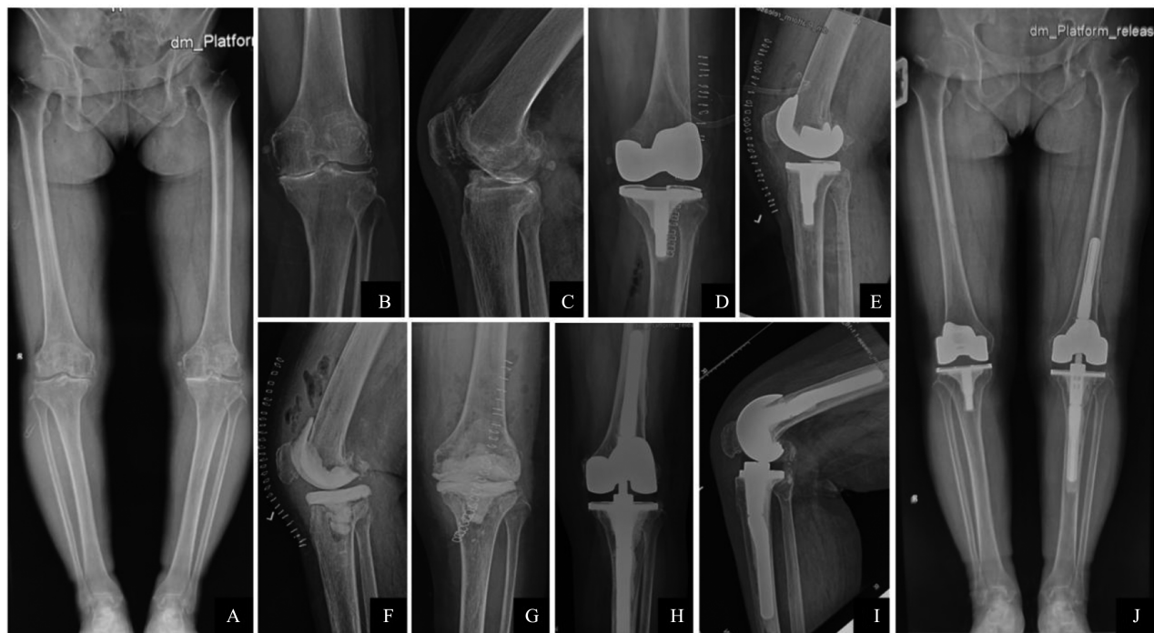
图2 病例2影像学检查

2019年7月就诊我院行左膝关节翻修术,术中见关节液清亮,未见明显炎性肉芽组织形成,股骨远端及后髌骨均可见非包容性骨缺损,应用髌限制性假体进行翻修,分别在股骨后髌、远端内外侧各安装5mm垫块填充骨缺损,安装D号股骨假体、3号胫骨假体、14mm垫片,股骨侧及胫骨侧分别应用直径13mm、长度100mm延长杆,术后关节稳定,刀口愈合良好,膝关节功能恢复良好,定期随诊未再有感染表现(图2H~J)。