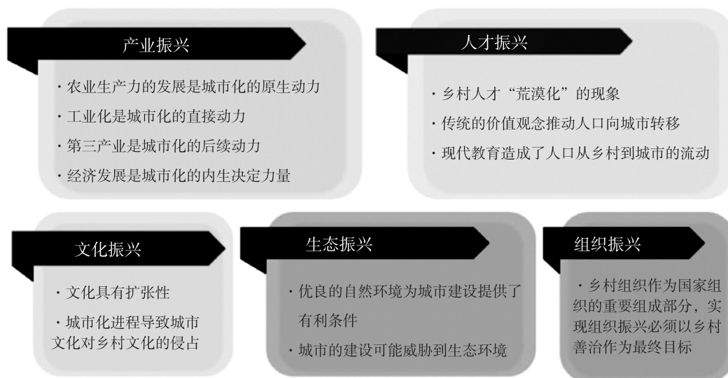
图1 “乡村振兴”五大维度与城市化相关内容的对应关系

乡村振兴与城市化并非简单的对立关系,而是相互促进、相互依存的,乡村振兴需要借助城市化的力量,而城市化也需要充分发挥乡村振兴的潜力。同时,将课程思政应用于乡村振兴,不仅能够提升农民的文化素养和社会责任感,还能够培养更多的乡村人才,推动乡村振兴的可持续发展。2018年3月,习近平总书记在参加十三届全国人大一次会议山东代表团审议时为乡村振兴指明了五个具体路径,即推动乡村产业振兴、人才振兴、文化振兴、生态振兴、组织振兴。产业振兴是乡村振兴的基石,产业结构的演变与区域城市化存在着互动机制 [4] 。人才振兴是乡村振兴的关键,一方面乡村人才出现“荒漠化”的现象,人才被驱动着从乡村转移到城市;另一方面,现代教育造成了人口从乡村到城市的流动 [4] 。文化振兴是乡村振兴的灵魂,城市化进程中城市的范围不断扩大,导致了城市文化对乡村文化的侵占。生态振兴是乡村振兴的条件,城市化过程中优越的自然生态环境为城市的建设创造了良好的基础条件,然而随着城市的快速发展,生态环境也受到了严重的威胁。乡村善治是实现乡村组织振兴的终极目标,是国家组织不可或缺的组成部分,应坚持落实党建,助力“乡村振兴”战略的实施。同样,城市化也得益于有效的组织领导。综上可得出“乡村振兴”五大维度与人文地理学中城市化相关内容的对应关系,如图1所示。