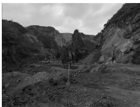
图2 六盘水水城区观音山矿山生态破坏图

示,受污染的地表水体面积达到了 30\text{hm}^2 , 周边地下水的多项指标也严重超标。此外, 矿山开采还导致植被破坏, 生物多样性大幅下降, 许多本地动植物种类因生存环境恶化而减少甚至消失。如图2所示, 六盘水水城区观音山矿山面临生态破坏的严峻问题, 该矿山原有植被覆盖率约为40%, 在开采后下降至15%左右, 动物种类也减少了约60%。