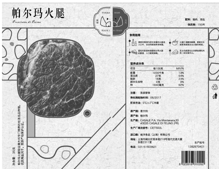
图3 西式火腿的包装设计

生态消费值和生态总计值。生态奖励值是消费者通过回收和再利用产品获得的。生态消费值是通过购买产品产生的,生态消费值为生态成本值的负值。生态总计值是生态奖励值和生态消费值的总和,反映了消费者的整体影响足迹。