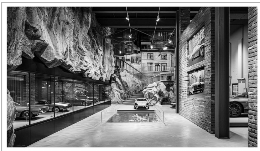
图 2 汽车厂历史文化街区展馆意向图

工业美学的数字转译在长春实践中获得现象学突破。铸造车间 VR 体验通过触觉反馈手套传递钢水重量变化,用户手臂肌肉的震颤记忆与 1956 年老师傅的操作日志形成跨时空共鸣;工人浴池 AR 场景中,蒸汽热浪的体感模拟与下班号声的声景重构,使“劳动身体”的记忆从视觉符号升维为多感官沉浸。这种“技术具身化”设计,将冰冷的机械叙事转化为可触摸的集体情