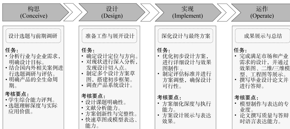
图1 基于 CDIO 理念的工业设计本科生毕业设计教学构架

育课程体系,以完善不同层次类型的工程教育和人才培养模式。20世纪90年代,通过立法并强制推行,日本高校已建立起“产学结合与实践教育”的教学模式,其中,工科类院校建立起“工学结合、产学协作”的教学体系 [3,4] 。