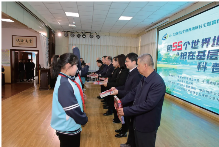
哈尔滨自然资源综合调查中心向黑河市第五小学赠送科普图书

在哈尔滨市,省自然资源厅工作人员来到东北林业大学,向学生们宣传“尊重自然、顺应自然、保护自然”的生态文明理念。活动现场,主题横幅高高悬挂,宣传展板、宣传资料的内容吸引了过往学生驻足观看。活动中,工作人员还就《黑龙江省黑土地保护利用条例》进行了普法宣传,邀请律师进行免费咨询服务,呼吁大家保护黑土地,共同爱护家园。同时,省自然资源厅门户网站、微信公众号同步发布世界地球日宣传视频、宣传海报等内容,营造地球日宣传活动氛围,有效提高了社会公众对世界地球日以及相关知识的认识性。