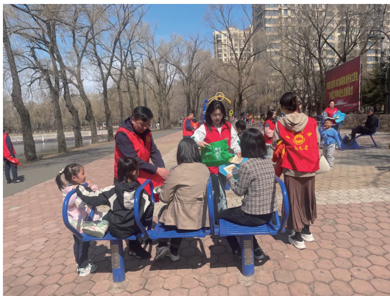
铁力市自然资源局工作人员走上街头宣传

绥化市自然资源局组织各县(市)自然资源局、北林分局、开发区分局干部职工在城区、村屯广泛开展自然资源保护利用,特别是黑土地保护相关政策法规和科学常识的普法宣传,将珍爱地球人与自然和谐共生的地球保护宣传理念、守护祖国大粮仓的黑土地保护倡议宣传到千村万户。