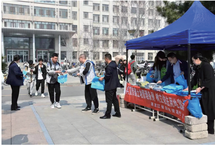
省自然资源厅工作人员在东北林业大学开展宣传活动

今年4月22日是第55个世界地球日。为引导全社会树立生态文明理念,推动建设美丽中国,共同构建人与自然和谐共生的地球家园,我省各地以“珍爱地球 人与自然和谐共生”为主题,组织开展一系列的主题宣传活动。