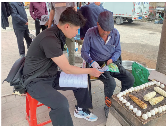
宣传人员向元宝村村民宣传土地相关知识

访农户、一对一交流的方式，深入了解农村土地管理制度现状和农民的现实需求，引导农民将保护耕地落到实际行动中，营造了人人保护黑土地的社会氛围。