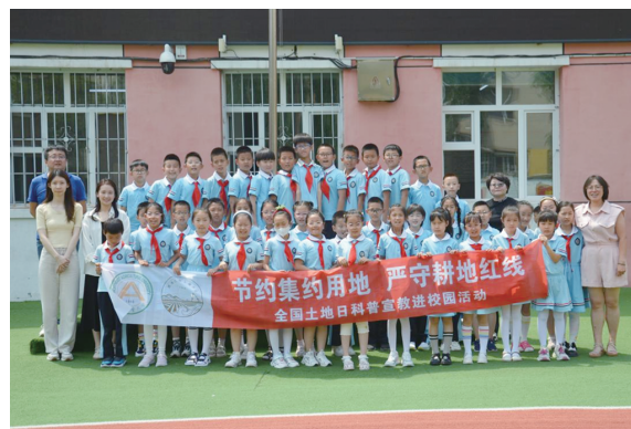
哈尔滨市中山路小学宣传现场

还向学生们分发了印有宣传标语的文具和零食包。学生们纷纷表示，将在课后继续学习保护黑土地的相关知识，争做保护黑土地的“小能手”。