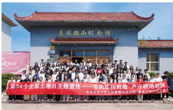
哈尔滨市尚志市元宝村宣传现场