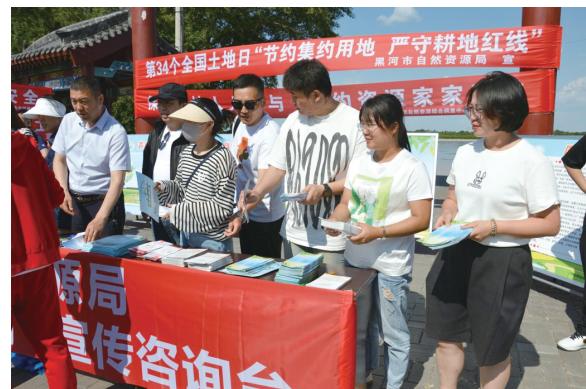
黑龙江省土地学会宣传人员为过往村民散发宣传单