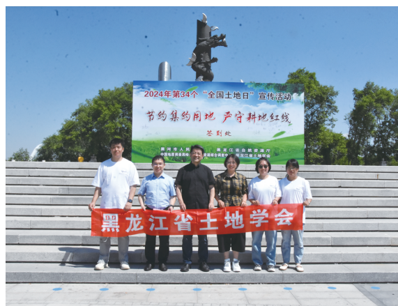
黑龙江省土地学会宣传人员在活动主会场

让群众知政策、懂政策，营造了依法依规用地的良好氛围，为新形势下黑土地保护工作贡献了学会力量。