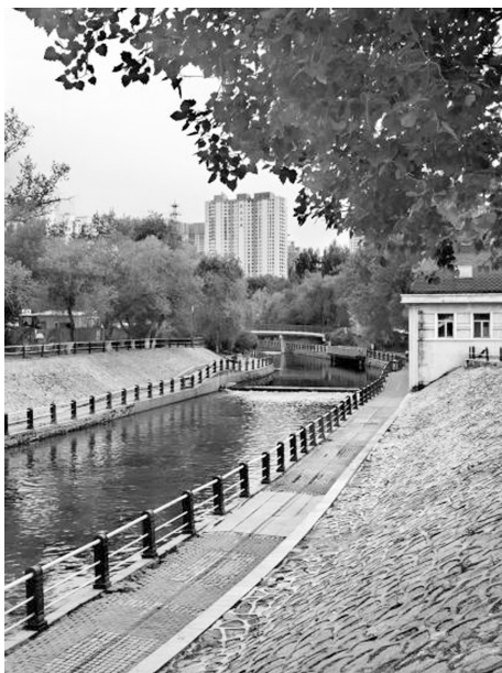
图 2 马家沟慢行步道

太阳岛景区的公众号和小程序内提供了景区地图和游览路线,有较强的参考性和便捷性,可以为游客提供指引。这是数字技术在移动端服务于导视系统的一个案例。在实地考察过程中,作者走访了太阳岛风景区、马家沟慢行步道等地,发现马家沟沿线经过多年的改造已具备了美化市容装点环境的作用,但是导视系统方面存在缺失(图 2)。马家沟沿线的慢行步道可以很好地和环境融为一体,但缺少导视系统,市民和游客在体验过程中容易迷失方向。