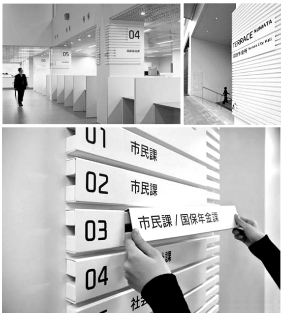
图4 沼田市役所可变换的导视系统设计

当下数字技术日趋成熟,人工智能技术呈现出爆发式的发展。在生态文化景观的导视系统设计中,可以将电子触摸屏、智慧音响和交互机器人等设备作为载体,融入 AI 大模型,将信息元