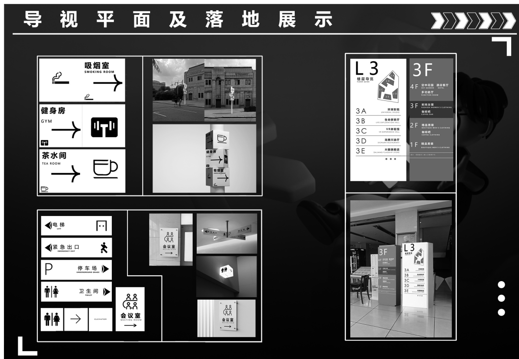
图 3 导视系统设计效果图(作者:胡豆,指导教师:冯启凡、李彩丽)

在视觉设计方面,可读性与可靠性是用户关注的首要维度 [2] ,应注重标识的简洁性和可识别性。采用清晰的字体、鲜明的色彩和简洁的图形,使标识在远距离也能被轻易识别。根据不同的场所和功能需求,设计不同类型的标识,如指示牌、地图标识、方向箭头等,以满足用户的各种导航需求。比如对道外历史街区视觉形象的符号设计方法是针对多种文化符号及重要特征形式的提炼,然后进行重组,进而表现、再现或纯符号形式表达的综合表达方式,道外历史文化中从