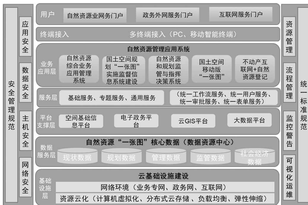
图1 信息共享服务系统架构图