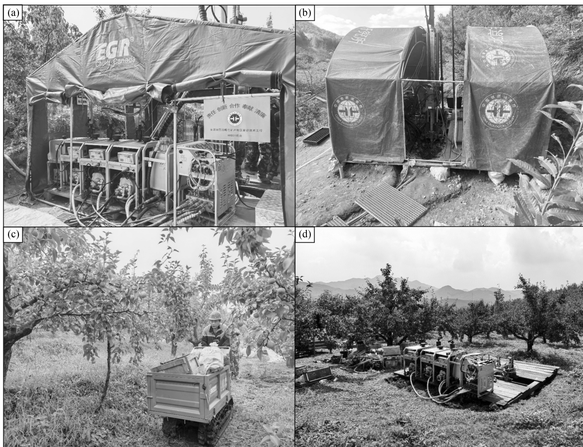
图 2 便携式模块化钻机(a-b)和机台建设(c-d)