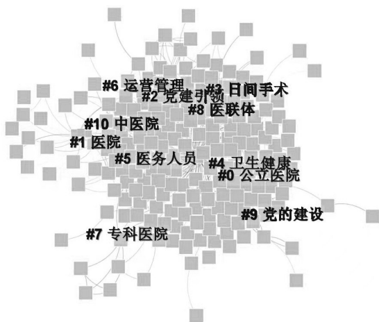
图2 公立医院高质量发展领域关键词共现及聚类图谱

11个聚类主要围绕4个主题展开:(1)医院类型(#0公立医院、#1医院、#7专科医院、#10中医院),主要