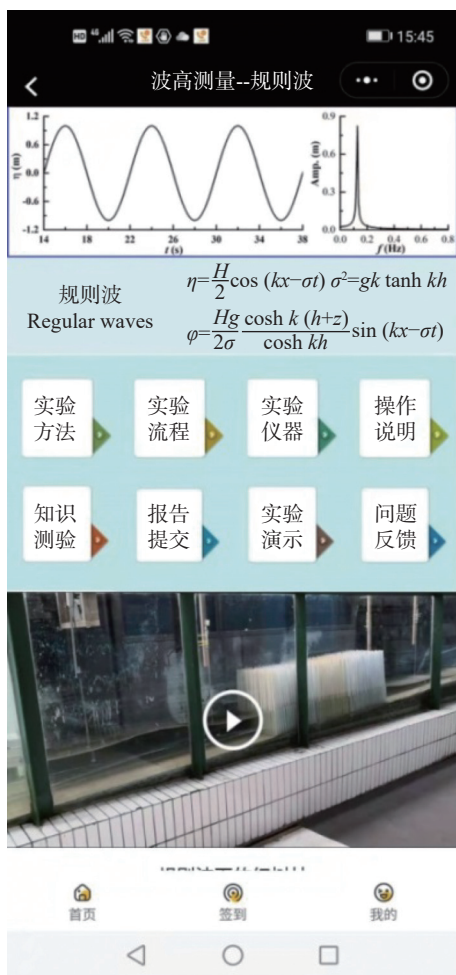
图2 波高测量-规则波小程序界面