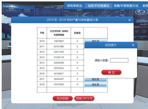
图4 选择年度赋权界面

式中: \hat{x}_{t+1} 为 t+1 预测值; x_t 为 t 期的实际值; \hat{x}_t 为 t 期的预测值; a 为平滑系数,一般取值 0 < a < 1 , a 值的确定可以依据时间数列的波动进行选择,初始值 x_1 自定。