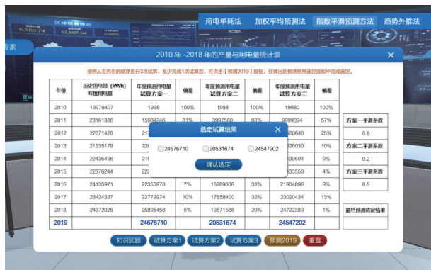
图5 多个试算方案的计算结果界面

学生观察历史年度用电量曲线,思考指数平滑方法初始值的取值和平滑系数 a 的取值范围。系统设计 3 个试算方案,学生通过多次试算,寻找综合误差率低的平滑系数,并计算年度电量预测值,如图5所示。