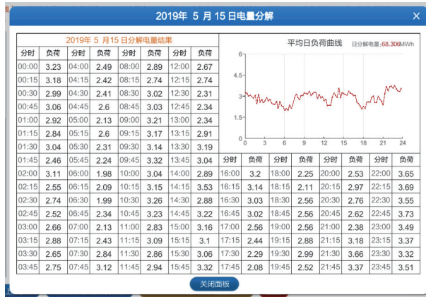
图 9 96 点日负荷预测界面

学生运用归纳法, 围绕实验结果, 对常见电量预测方法的特点和准确度进行总结, 并就如何提高预测准确度做出进一步探究性讨论。