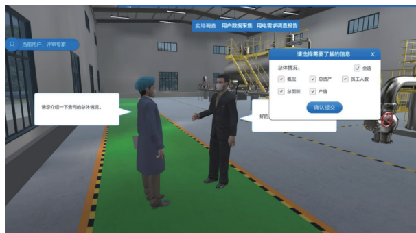
图 2 电力用户访谈界面

电量统计表及曲线，学生概括用户需求资料的轨迹，构建年度电量预测模型，并预测该用户下一年度电量，包括以下 5 个交互性实验步骤。