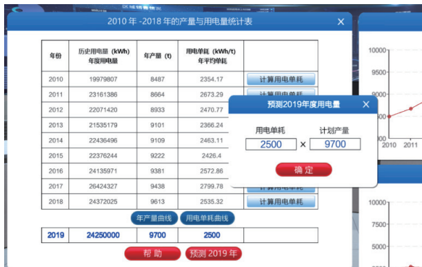
图3 用电单耗法预测用电量界面

学生观察用电单耗曲线,思考历史用电单耗变化的影响因素,确定综合用电单耗。根据客户调查阶段获取的数据,估算该用户下一年度的计划产量。构建用电单耗预测模型,对该用户下一年度用电量做出预测,如图3所示。在此操作过程中,可通过系统提供的“帮助”功能,快速回顾单耗法预测模型的知识点。