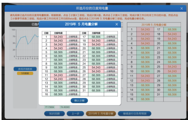
图 8 计算目标月的所有日分解电量界面

学生选择需要分解的目标月, 系统提供目标月前一年 12 个月的日用电量曲线图。学生观察分析该用户 12 个月的日用电量曲线, 依据相似性、延续性等原则, 选择多个月的日用电量作为样本数据, 分析样本数据随着时间变动的周期性规律, 计算工作日与非工作日的季节系数, 运用季节系数法, 获得目标月每日用电量的预测值, 从而将电力用户月度用电量的预测值进一步分解到该月的每一天, 完成日前交易市场申报, 如图 8 所示。