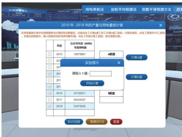
图 6 输入预测期的 t 值界面

学生观察历史年度用电量变化曲线，选择用于预测的用电量样本数据；系统基于所选择的样本数据计算系数 a 、 b 的数值。根据所选择的样本数量，学生思考并填入下一年 t 值的取值，系统计算并输出下一年度用电量的预测值，如图 6 所示。