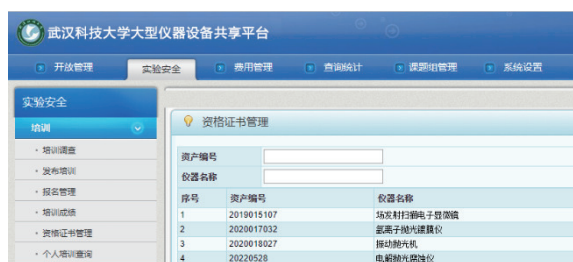
图3 武汉科技大学大型仪器设备共享平台

中心完成了安全教育及准入系统信息化配套建设。武汉科技大学大型仪器设备共享平台如图3所示,各类学习者均可在信息化平台上完成培训,主要步骤如下:学习者必须跟课题组责任教师及设备安全负责人确定培训需求;在信息化平台上进入培训界面,选择自己的学号以及实验活动,实验活动会根据学号所属专业的研究方向显示一些默认的内容;根据实验活动选择配套的安全教育课程,并就教育培训内容进行建档;完成准入规定的培训要求,获得进一步实验培训的资格。