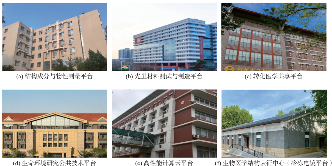
图1 山东大学校级公共技术平台展示

靠资产与实验室管理部,下设若干校级公共技术平台,主要负责平台统筹规划,平台服务运行体制机制优化完善,平台各项运行、评价制度制定,学校各类教学、科研公共测试及技术培训等工作。目前山东大学校级公共技术平台建设成效显著,已建成生命环境研究、生物医学结构表征中心(冷冻电镜平台)等6个校级公共技术平台,如图1所示,配备球差校正透射电镜、300 kV 冷冻透射电镜等千万级高精尖设备,发挥设备集群优势,支撑重大科研成果在Science、Nature、Cell等国际权威期刊发表,有力支撑学校人才培养、科学研究和学科建设。