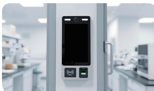
(b) 智慧门禁管理系统