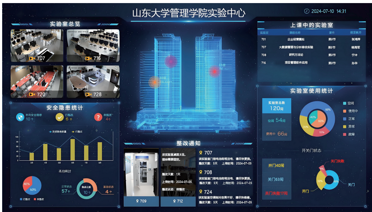
图 4 实验室安全数据系统看板

系统支持自动排课和冲突检测，确保实验室资源的合理分配和高效利用。支持资源使用统计和详细报告功能，帮助实验室管理者全面了解资源使用情况，进行更加精准的资源优化配置，提升实验室的整体运营效率。实验室安全数据系统看板如图 4 所示。