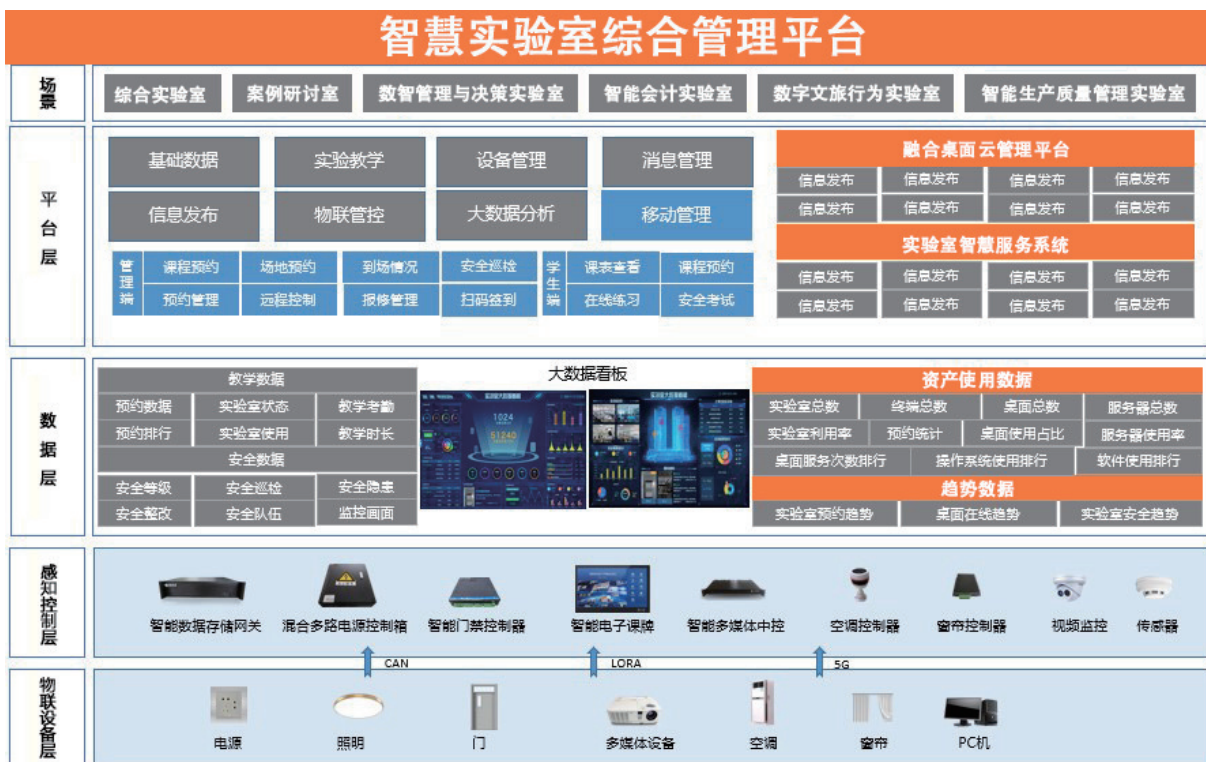
图 1 智慧实验室综合管理平台系统方案架构图