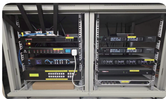
(c) 智能电源管理系统