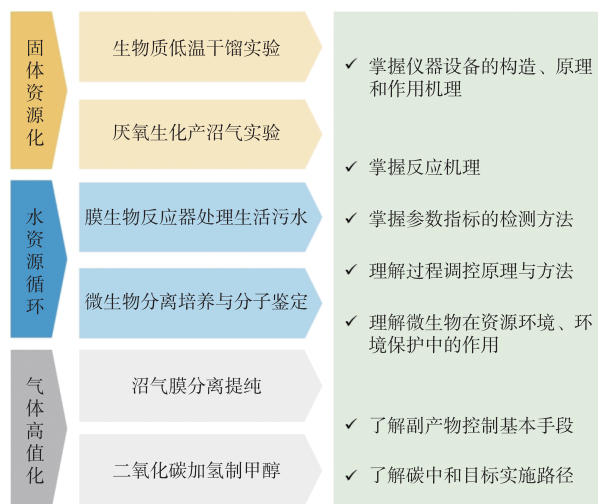
图2 专业实验课程能力培养目标结构图

专业实验课程的优化设计,旨在提高学生的专业素养和综合能力,培养学生对处理不同类型生物质利用全流程关键环节中所涉及理论知识 and 实验方法的掌握,如图2所示。