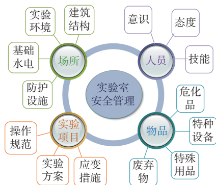
图 1 实验室主要安全因素构成图

实验室安全因素主要分为人员、场所、实验项目和物品 4 大方面,如图 1 所示。其中人员风险因素含有意识、态度和技能;场所风险来源于实验用房的建筑结构、实验环境、基础水电和防护设施;实验项目风险主要是操作规范、实验方案和应变措施等;物品风险来源于危化品、特种设备、特殊用品和废弃物,它们都是实验室安全隐患和风险的主要来源 [3] 。如何在安全准入前将实验人员、场所、实验项目、物品存在的安全风险识别出来,并进行“定制化”安全准入的培训教育?针对风险识别提出有效的综合管理解决方案后,怎样在加强安全管理效率的同时提高实验室安全系数?这些问题均值得深入探讨和研究。