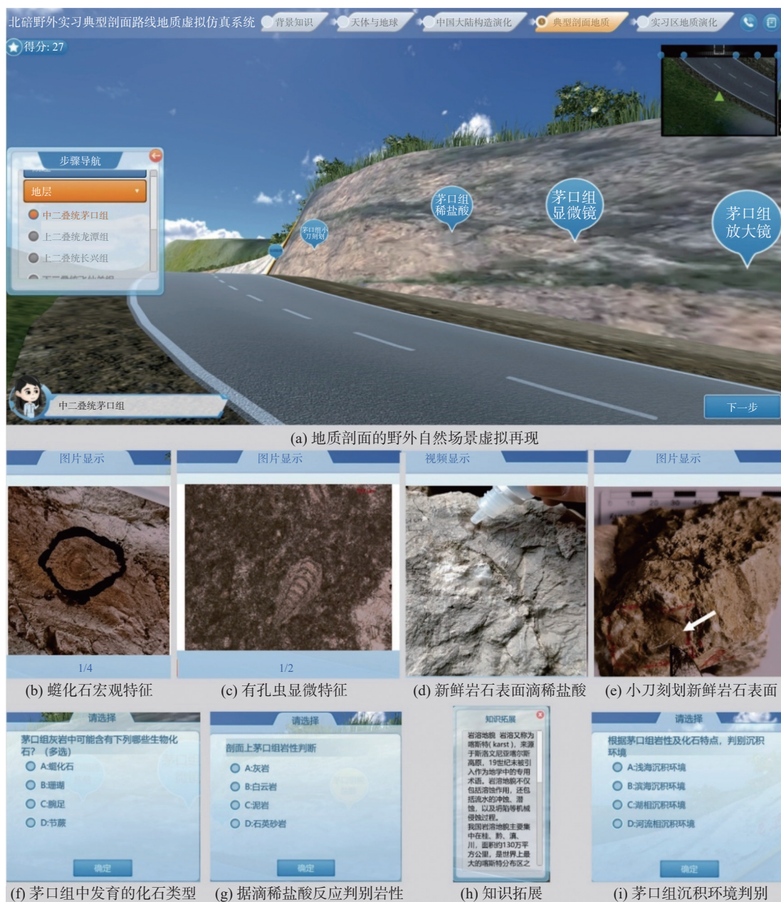
图 2 虚拟仿真系统典型剖面地质模块界面

是否产生气泡及气泡数量的多少来区分白云岩、灰岩与泥灰岩，如图 2(g)所示；点击“小刀刻划”，观察如图 2(e)所示的小刀刻划岩石新鲜面后，是否出现划痕、粉末来判断岩石与小刀硬度的相对大小；点击“知识拓展”，了解如图 2(h)所示的碳酸盐岩区发育的喀斯特地貌等知识。观察完以上岩石学及古生物学等特征后，以图 2(i)所示的选择题让学生判断茅口组的沉积环境。 “构造”部分主要以 3 维模拟视频的形式展示了实习区内褶皱和断层的形成原理、地质图中褶皱的形态及以信手剖面的形式展示实习区断层的发展特征。