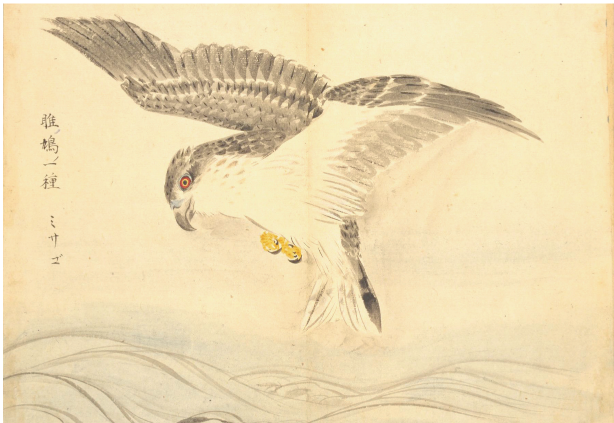
《诗经》里的雉鸠，1874年《诗经名物图解》插图，日本学者细井侗所撰

类繁殖不再仅仅依靠男女的两性关系发生才能顺利进行。试管婴儿技术的成熟，意味着借种生子的可能。同时丁克家族的诞生更是为婚姻的繁殖功能关上了一道门。