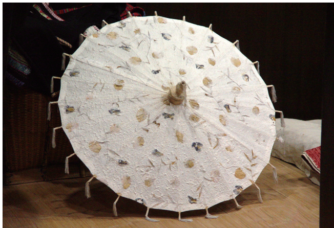
上: 构皮纸伞 下: 构皮纸灯