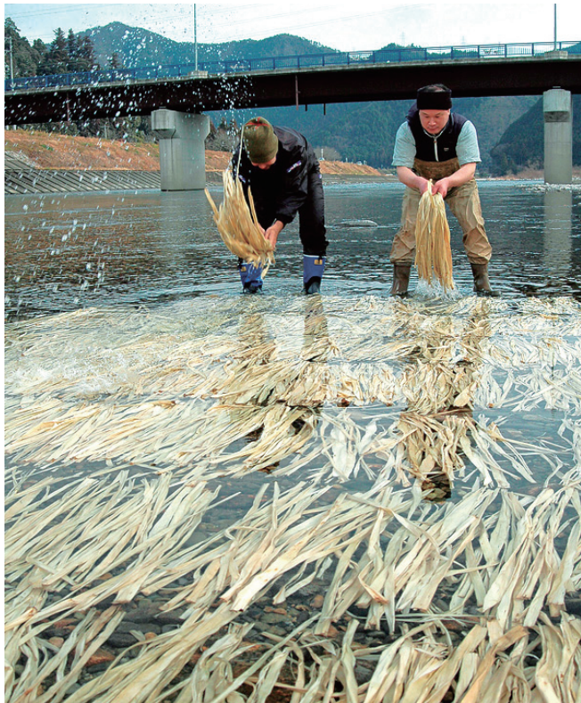
上：构皮纸工艺品 下：清洗构树皮

鱼疏》中记载有“荆、扬、交、广谓之穀……今江南人绩其皮以为布，又捣以为纸，谓之穀皮纸”，“交”指交州，在今越南境内，这说明至少3世纪的时候越南已能制作构皮纸。6世纪日本政府为了大批印制佛经，模仿“唐纸”学习造纸并生产纸张，造纸的原料构树也开始在日本种植。日本不断地对造纸工艺加以改进，后来就有了和纸的诞生。目前日本和纸主要以构树、黄瑞香和雁皮