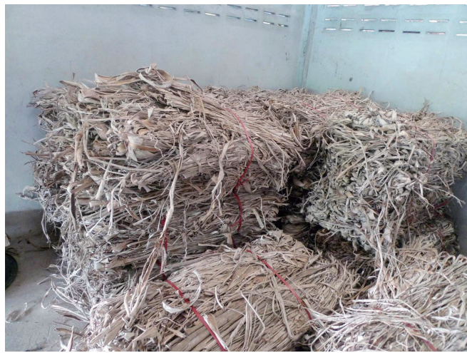
构树皮——造纸的原料

构树皮造纸历史悠久，对中华文化数千年的记载与传承有重大意义。很多古籍中记载了楮纸的制作方法，《天工开物》年中写道：“凡皮纸，楮皮六十斤，仍入绝嫩竹麻四十斤，同塘漂浸，同