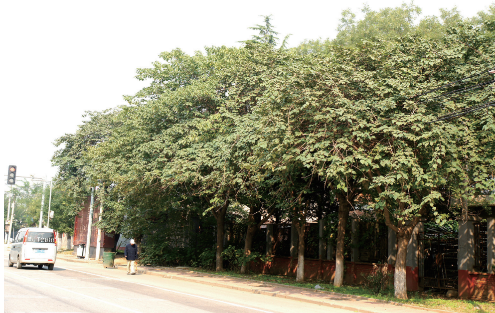
构树用于道路绿化

构树生长快速、枝繁叶茂、树形优美、适应能力强、病虫害少，十分适合做庭荫树和行道树，是公园及风景旅游区常见的绿化树种。其实古时候构树就经常出现在住所庭院中，既美化环境，又遮阴避暑。宋朝诗人刘克庄在《楮树》中写有“楮树婆娑覆小斋，更无日影午窗开”，宋朝张耒所作《满庭芳·裂楮裁筠》中写有“裂楮裁筠，虚明潇洒，制成方丈屠苏。草团蒲坐，中置一山炉”，这里的“楮树”“楮”就是指现在的构树。它们凭借快速生长、冠大阴多的优良特性，常种于房前屋后、庭院花园中。除此之外，流传下来的还有两大经典诗词，分别讲述了东坡居士花园中和袁中道楮亭旁的构树。