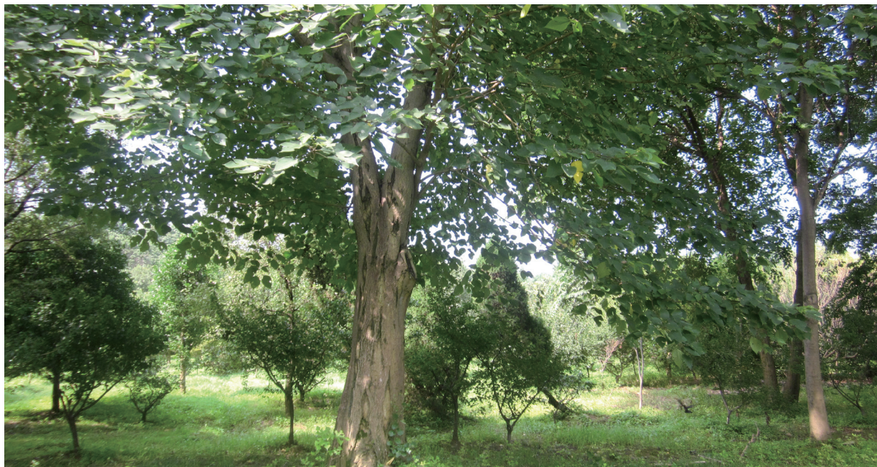
南京中山陵园里的一棵古老构树