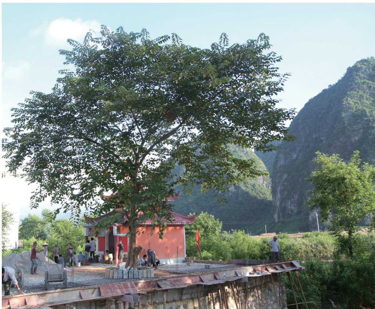
广西一个庙宇旁种植的高大构树