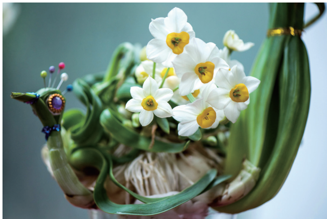
上：福建漳州水仙花雕刻艺术品 下：欧洲水仙——‘幸运’

目前，我国水仙花品种分福建漳州水仙花、浙江舟山野生水仙花和上海崇明水仙花三大品种，其中以漳州水仙花最为著名。漳州水仙花具有产量高、花球大、花株多、花期长、分外香5大特点，故有“天下水仙数漳州”之美誉，并被选为漳州市市花。水仙按花型可分喇叭水仙、橙黄水仙、红口水仙、长寿水仙、花轴水仙，此中又有单瓣和复瓣之分。单瓣花有内外两层，香味浓郁，以“金盏银台”最为盛名，在其盛开时犹如仙子凌波，呼之欲出。复瓣花黄白相间，花瓣微皱，香清味幽，美其名曰“玉玲珑”，与“金盏银台”有姐