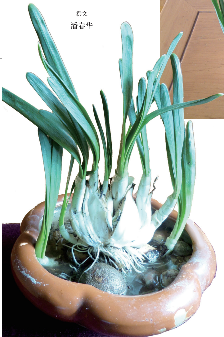
水仙的植株