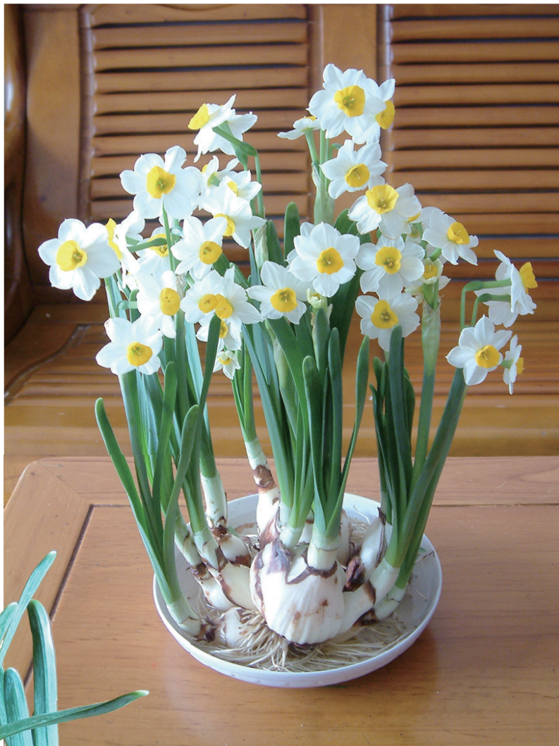
中国水仙——‘金盏银台’

数九寒冬，百花凋零，唯有水仙花敢与斗寒傲雪的梅花媲美。婷婷玉立的水仙犹如淡妆害羞的少女，在嫩绿翠叶的陪衬下，绽出朵朵洁白如玉、花蕊淡黄的小花，散发出阵阵清香，令人心醉。