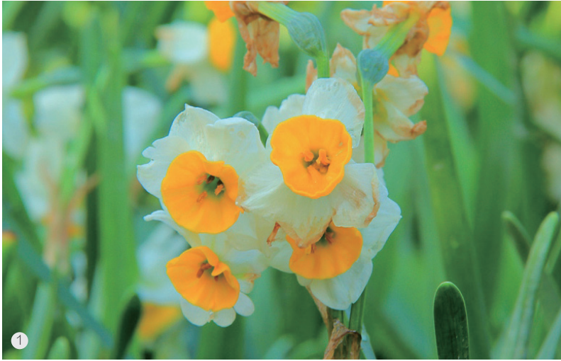
1. 中国水仙——‘金盏银台’ 2. 欧洲水仙——‘活报剧’ 3. 水仙——从鳞茎到开花