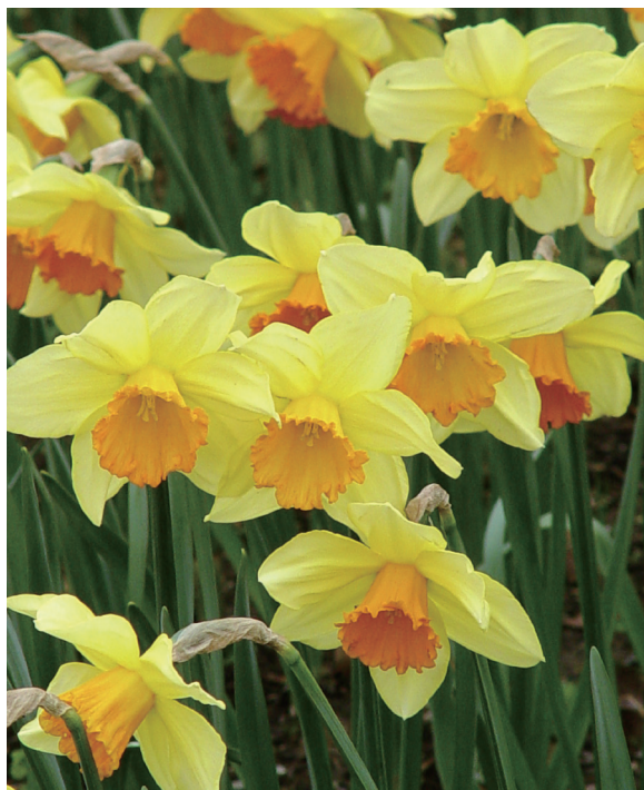
水仙——‘黄太阳’