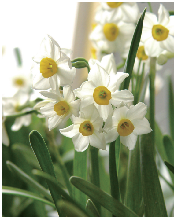
中国水仙——‘金盏银台’