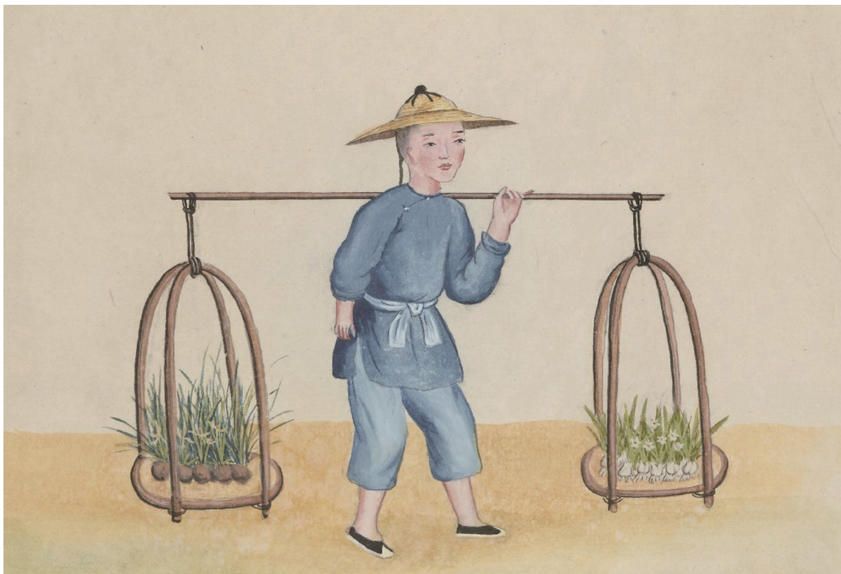
19世纪水粉彩画：卖水仙花，清代京城市景风俗图

形似蒜头，叶片翠绿呈扁平狭长状，每个鳞茎可抽花茎1~2枝，多者可达8~11枝。花葶从叶丛中抽出，每葶开花六七朵，花瓣6片，排列成伞形花序，簇拥勾头。有的像倒挂金钟，有的似金盏银台，有的如玲珑玉蝶，可谓高雅绝俗，仪态万千。