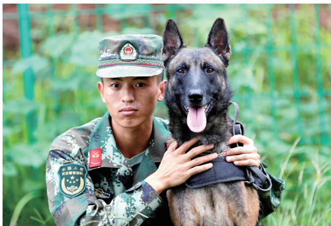
左：工作犬 右：导盲犬