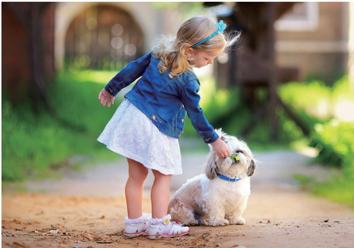
狗是人类最忠实的朋友

狗的确是人类忠实的朋友。人类最早驯化畜养的家畜就有狗，乃六畜之一。《三字经》云：“马牛羊，鸡犬豕，此六畜，人所饲。”十二生肖