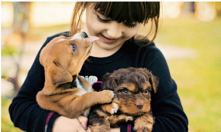
左：中国剪纸艺术“十二生肖——狗” 右：狗是人类亲密的玩伴