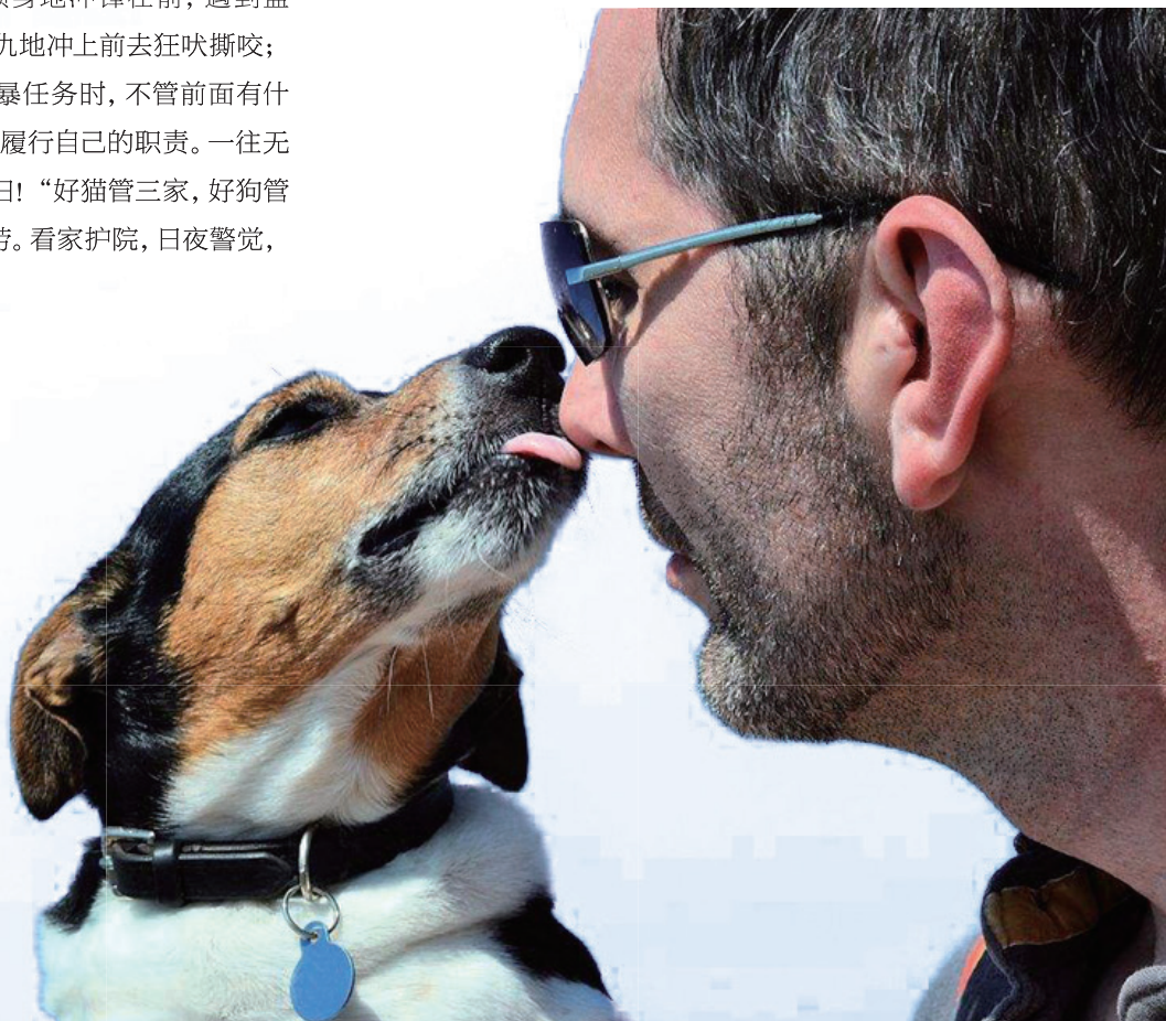
上：狗拉雪橇 中：狗与花 下：与狗亲密无间