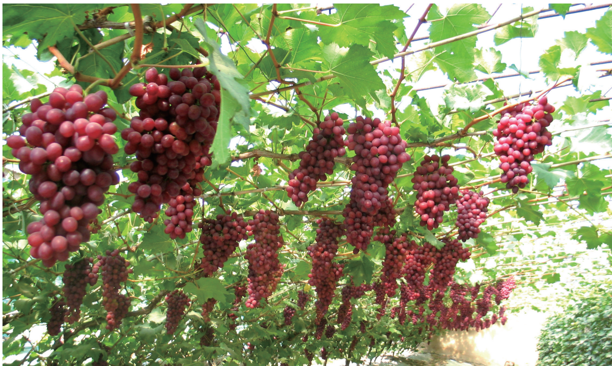
‘京秀’日光温室结果情况

葡萄的性状多为多基因控制的数量性状。QTL定位主要是利用统计学技术，解析杂交群体中染色体上分子标记与表型差异的关系，通过构建遗传图谱挖掘控制相应性状在基因组上的位置以及其遗传效应，并把该位置作为分子辅助育种的标记。优质高抗逆新品种是育种者永恒的追求，因此葡萄QTL定位研究主要集中在两个方面：