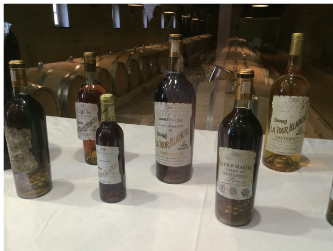
左：贵腐酒——葡萄酒酒中之王 右：苏玳一级庄白塔酒庄Château la Tour blanche年份悠久的展品 下：托卡伊是贵腐酒的产区之一

收回来，先用压榨机将葡萄进行压榨，再将葡萄汁进行酒精发酵。在发酵到一定程度后，人为地降低温度并加入适量二氧化硫终止发酵。在酒精发酵终止以后，酒中依然含有非常高的残余糖分。随后，这些贵腐酒经过18个月左右的橡木桶陈酿之后，才能装瓶投入市场。而在托卡伊，人们首先采收健康没有感染贵腐菌的葡萄，然后压榨并进行酒精发酵。在酒精发酵过程中或者发酵过程结束后，将侵染贵腐菌的葡萄倒入其中浸泡数天，以提取葡萄中的糖、