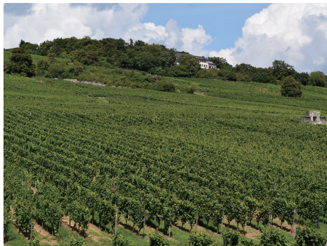
上：显微镜下的贵腐菌