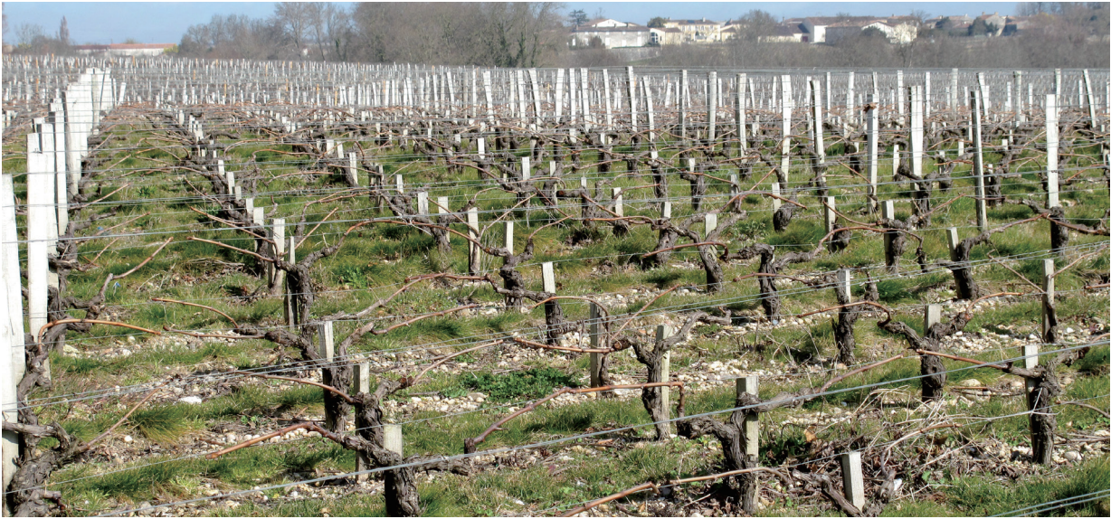
上：波尔多地区的葡萄园