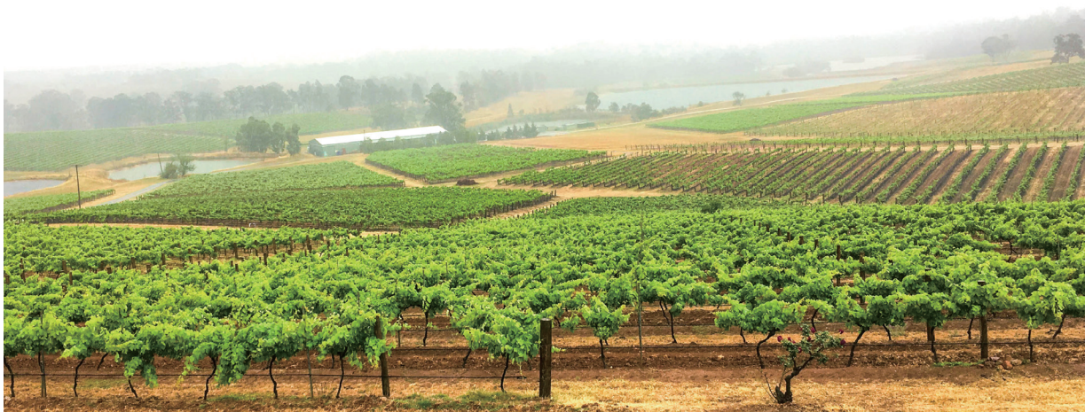
上：澳大利亚猎人谷的葡萄园