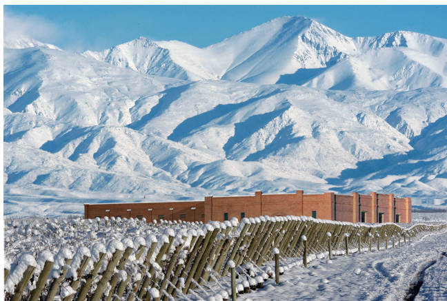
上：阿根廷冬季的葡萄园（图片来源winefolly.com） 下：加拿大被冰雪覆盖的葡萄（图片来源winefolly.com）