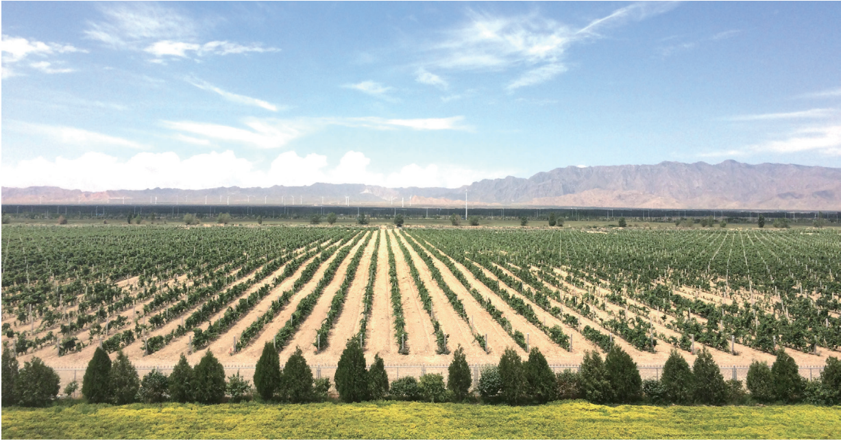
上：宁夏贺兰山东麓葡萄园 下：新疆葡萄园