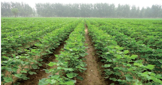
转基因棉花田

转基因植物是指把从微生物、植物和动物获得的重要功能基因,利用生物化学方法将功能基因和调控基因表达的DNA序列组合成一