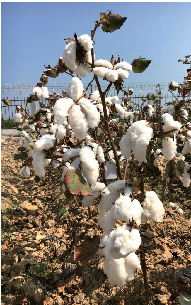
上:棉铃虫 下:转基因棉花