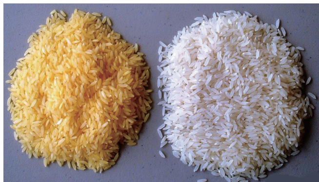
富含维生素A的黄金大米（左）

CP4 EPSPS抗草甘膦除草剂的机理是：植物体内氨基酸合成过程中需要EPSPS蛋白，大多数植物体内的EPSPS蛋白能够和草甘膦除草