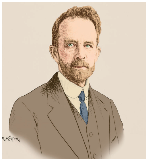
托马斯·亨特·摩尔根