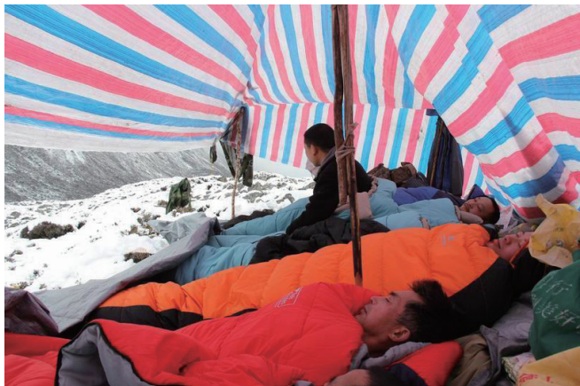
上下：冬天野外巡护，真是风餐露宿

50米开外的竹林里，工作人员发现一只削瘦的大熊猫在吃竹子，动作很慢。担心这只大熊猫有问题，工作人员小跑了一个多小时到山下，找到有信号的地方报警。报完警，他们又跑回上山，细心守护受到惊吓而藏起来的大熊猫。直到等来了专业救护人员，把它成功营救下山，