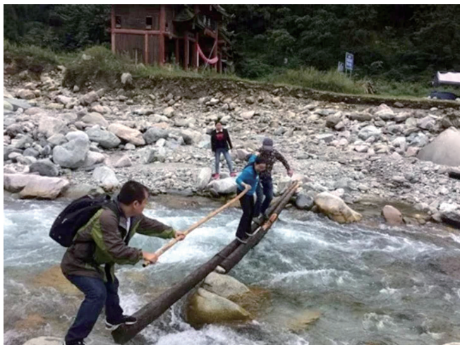
上：简易的小桥 下：野外的大熊猫

如果巡护路线更长，他们一天没办法返回，就只能背上帐篷和干粮，晚上找个平坦的地方扎营。手机变手表，微微手电筒的光亮在远处看像一个永不陨落的星星，灯光虽小但