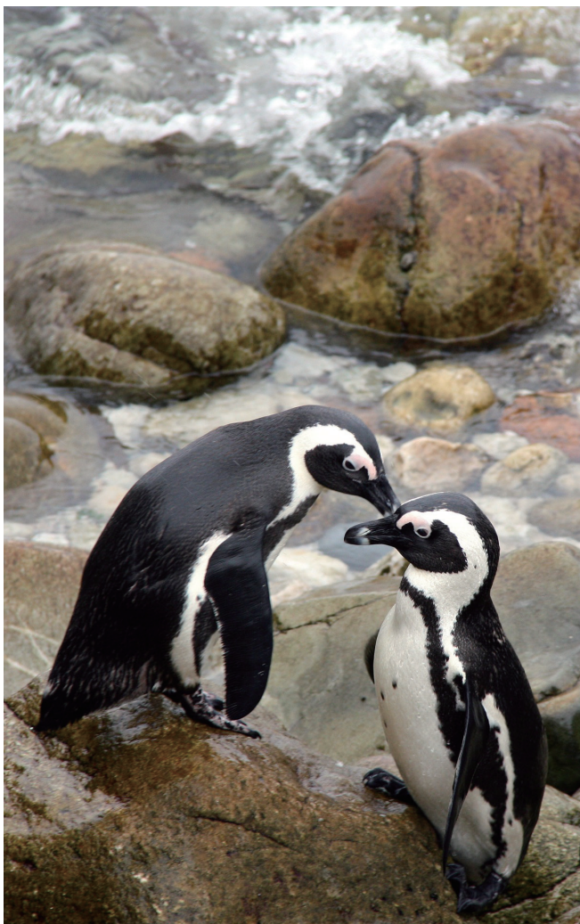
上：企鹅走起路来总是摇摇摆摆 下：一对企鹅