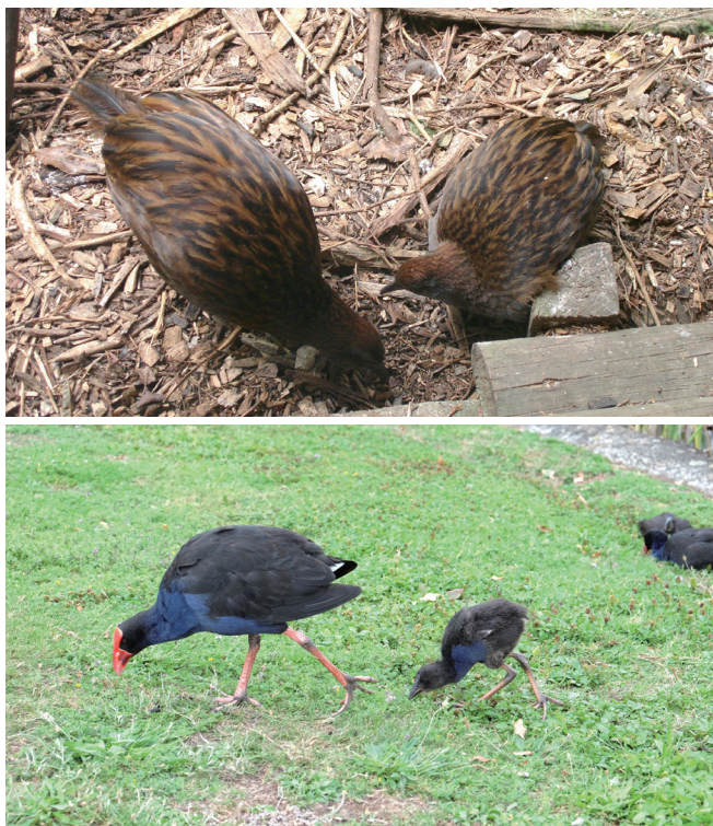
上：本土动物园里的新西兰秧鸡

紫水鸡属的属名为 Porphyrio ，其来自希腊语，为紫色之意，然而该属的物种并不都为紫色，例如澳大利亚的豪勋爵岛紫水鸡 ( Porphyrio albus )，其为白色。该属共有约7种，包括紫水鸡 ( P. porphyrio )、淡青水鸡 ( P. flavirostris )、紫青水鸡 ( P. martinica )、辉青水鸡 ( P. alleni )、南秧鸡 ( P. hochstetteri )，以及已经灭绝的2种：豪勋爵岛紫水鸡和北岛巨水鸡 ( P. mantelli )。其中南秧鸡和北岛巨水鸡