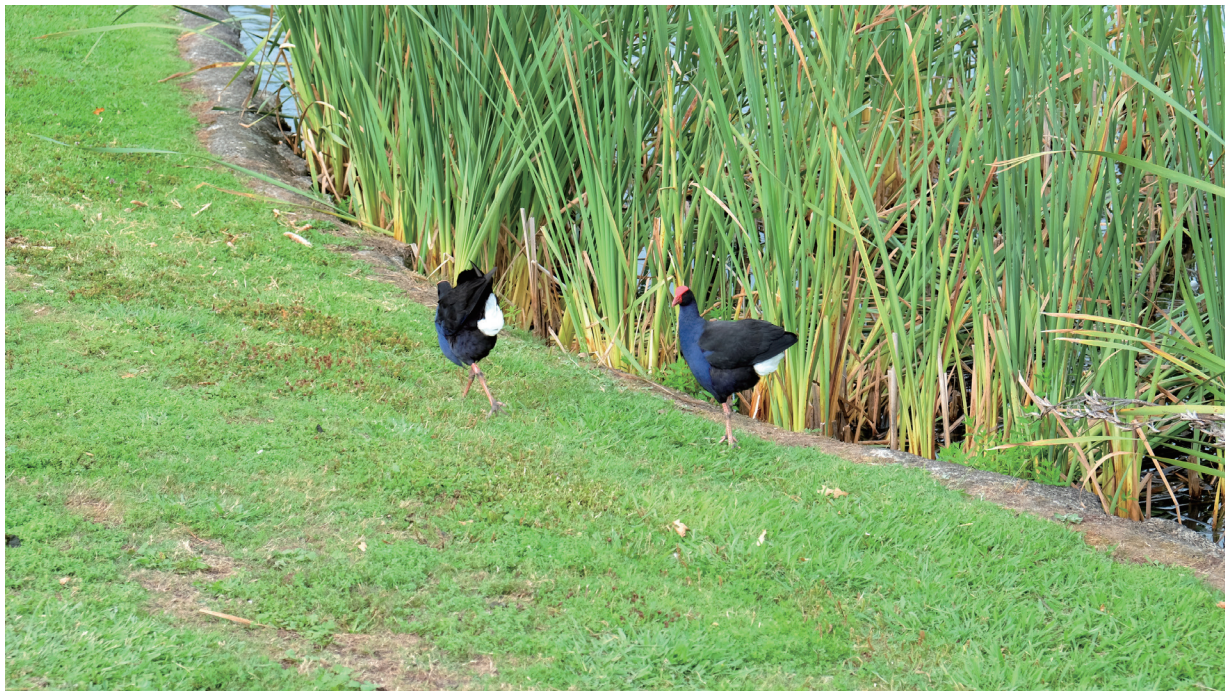
紫水鸡尾部显眼的白色覆羽

许听起来更容易记住。然而在新西兰，没有人这样称呼它们，也没有人称呼它们为Purple swamphen，它们被统一称作Pukeko（毛利语）。新西兰湿地鸟类较多，本土鸟类中约有30%为湿地鸟类，而Pukeko是新西兰最常见的湿地鸟类之一。