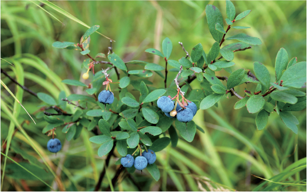
上：笃斯越橘 中：笃斯越橘群落 下：越橘植株