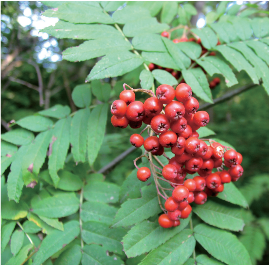
左上：苦糖果 右上：长白蔷薇 左中：毛山楂 右中：山刺玫 下：花楸