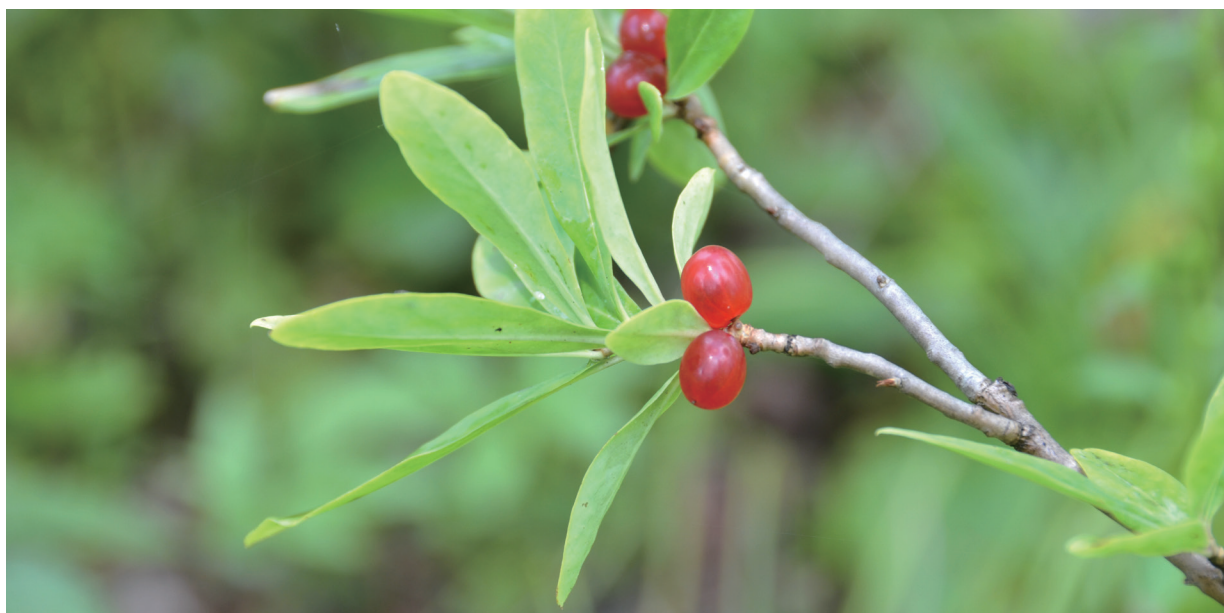
上：稠李 下：长白瑞香