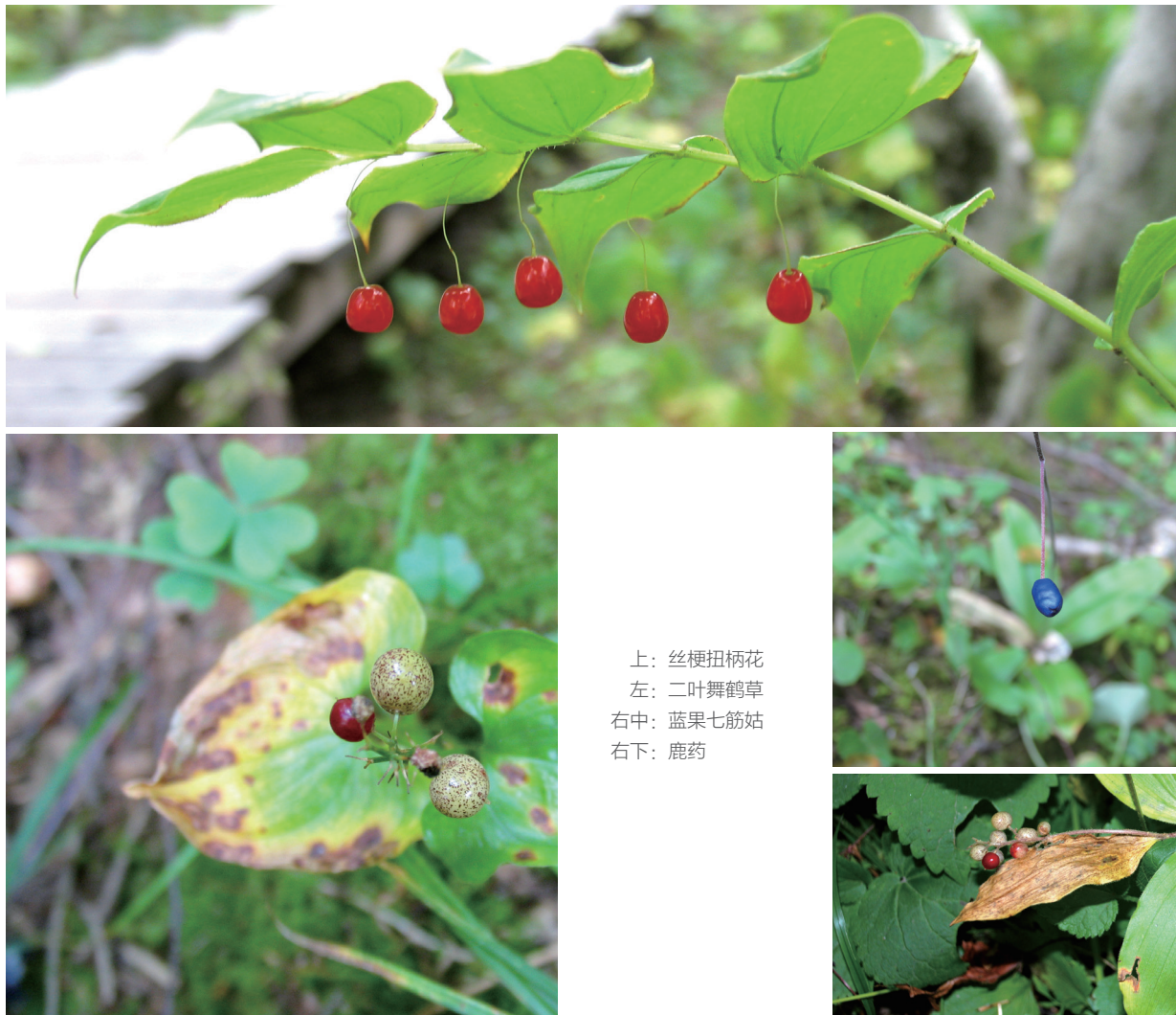
上：丝梗扭柄花 左：二叶舞鹤草 右中：蓝果七筋姑 右下：鹿药

可以食用。毛山楂 ( Crataegus maximowiczii ) 是山楂属的小乔木，果实个头比平常吃的山楂要小很多，但果肉又粉又面，口感很好。花楸 ( Sorbus pohuashanensis ) 的果实数量多，密集着生于枝条顶端，红果累累，不仅有观赏价值，也可以食用。蔷薇属的有长白蔷薇 ( Rosa koreana ) 和山刺玫 ( R. davurica )，前者果实长椭圆形，后者圆球形，成熟后都是鲜红色，十分醒目。忍冬科的苦糖果 ( Lonicera standishii )，成熟的果实外形奇特，由于双花并生在一个花梗上，两个紧邻的果实就像人类的连体婴儿。靠近花梗部分长在一起，让果实外形酷似双腿开叉的裤裆，由于太过不雅，取其谐音变成了苦糖果。一些地方因为它的果实形状有点像驴身上驼着的布袋，又称其为“驴驮口袋”。