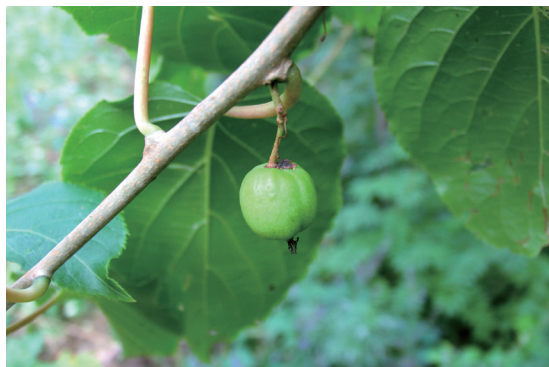
左上：东北茶藨子 右上：软枣猕猴桃 左下：狗枣猕猴桃 右下：长白茶藨子