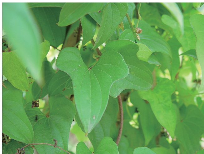
上：薯蓣，18世纪《中国药用本草绘本》彩绘本插图 下：薯蓣

薯蓣的块茎，也就是我们常说的山药，其功能之一是药用，也就有了作为药材所重视的产地溯源。《山海经》中提到的山药产地“景山”是现在的山西闻喜县，宋朝苏颂所著《本草图经》记载“生嵩山山谷”，而明朝朱棣皇帝所著《救荒本草》记载“生辉县太行山山野中”，这些野生品均在山西、河南一带。明朝以后，河南山西交界的地区即古“怀庆府”地区（现在的河南温