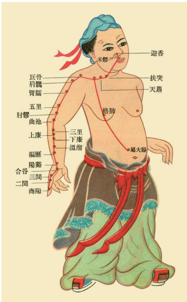
手阳明大肠经之图

取坐位, 右手拇指从大肠经起始穴(商阳)开始沿着大肠经循行路线依次推至大肠经止点穴(迎香), 再从迎香开始反向推至商阳穴, 如此往返36次。这样经络推拿可以起到的作用: 疏通气血, 去除痰瘀。特别是当您在大肠经循行部位摸到砂粒、囊泡、结节、条索时, 就说明大肠经脉里堵塞了垃圾, 这些垃圾中医称为“痰瘀”。所谓痰就是体内水液代谢紊乱, 多余水分停在体内凝聚为痰; 所谓瘀是指体内血液循环障碍停在经脉内或脏腑内, 或血溢出脉外形成的病理产物。坚持循大肠经络推拿, 可以渐消缓散大肠经的垃圾, 这可是一个细水长流的事情, 大家一定要坚持呀!