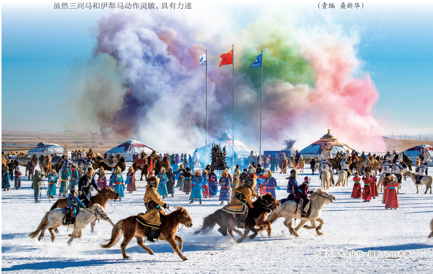
—内蒙古马术文化节