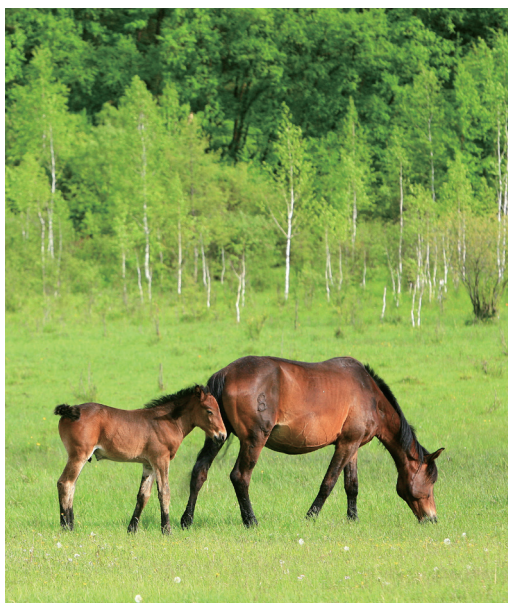
三河马 供图 / 视觉中国

马术运动是奥林匹克运动会上唯一一项与动物共同完成的比赛。因此，马术运动强调骑手对马的控制技巧和配合，而正是这一特点使中国骑手可以在体格上扬长避短，在竞技中获得天然优势。就如中国的乒乓球运动一样，广泛普及的休闲骑乘运动也将在全民参与的热潮中孕育出能够在奥运会上摘金夺银的骑手。