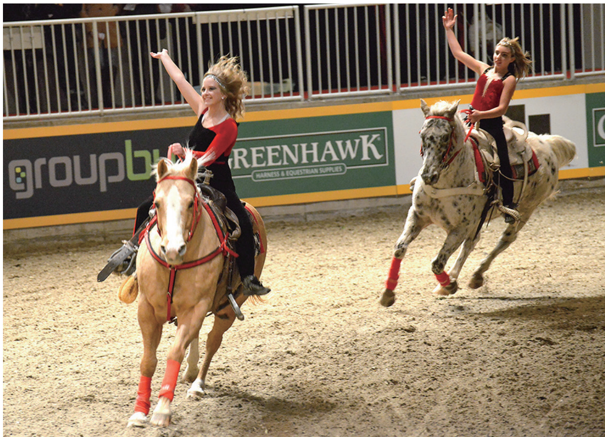
马术技巧（夸特马与美国花马）

本国经济的影响将有近千亿美元的上升空间，而这千亿经济影响来自哪个方面，是当今中国马业发展的一个重要课题。