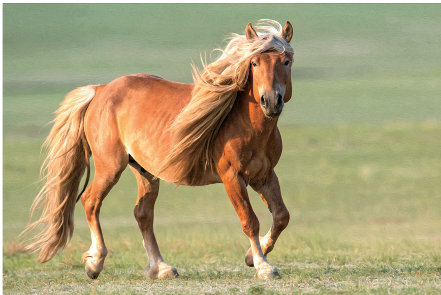
蒙古黄骠马

显示，在过去的10年，内蒙古马匹数量增加迅速，并于2014年分别超越全国马匹数量曾是最多的省份四川和贵州。2018年，被誉为“马背民族摇篮”的内蒙古自治区马匹存栏量达84.8万匹，跃升为全国第一。内蒙古马匹总数的增加正是因为近年来各种民族赛马赛事的增多、奖金的增多、牧民饲养的改良马增多的结果。