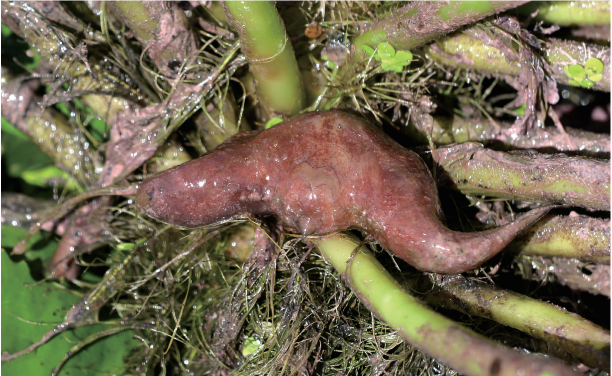
上：红菱 中：沙角菱 下：老乌菱