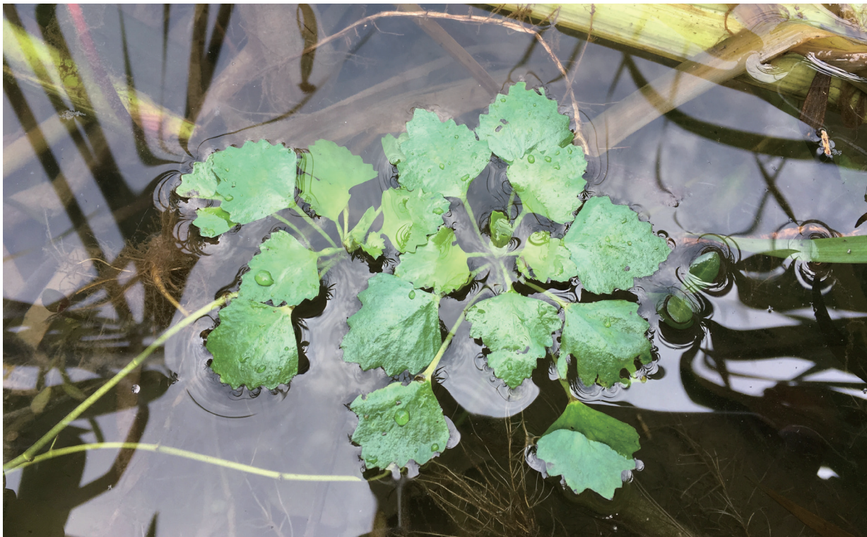
上：菱角 中：菱花 下：野菱