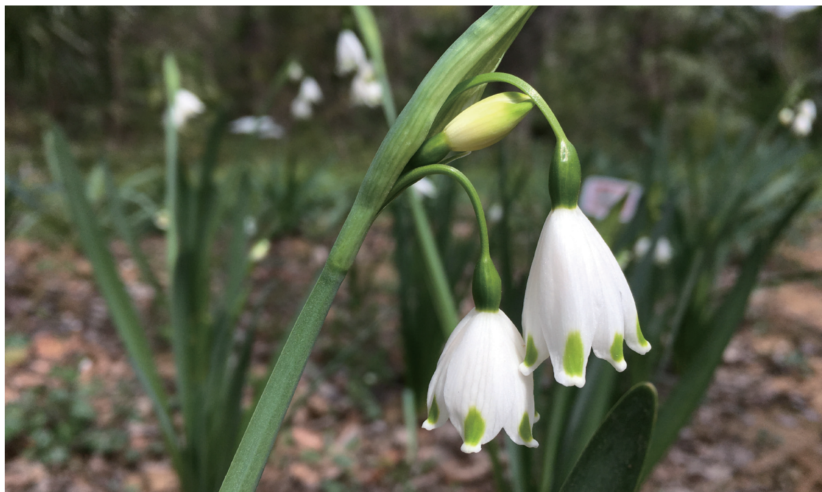
夏雪片莲