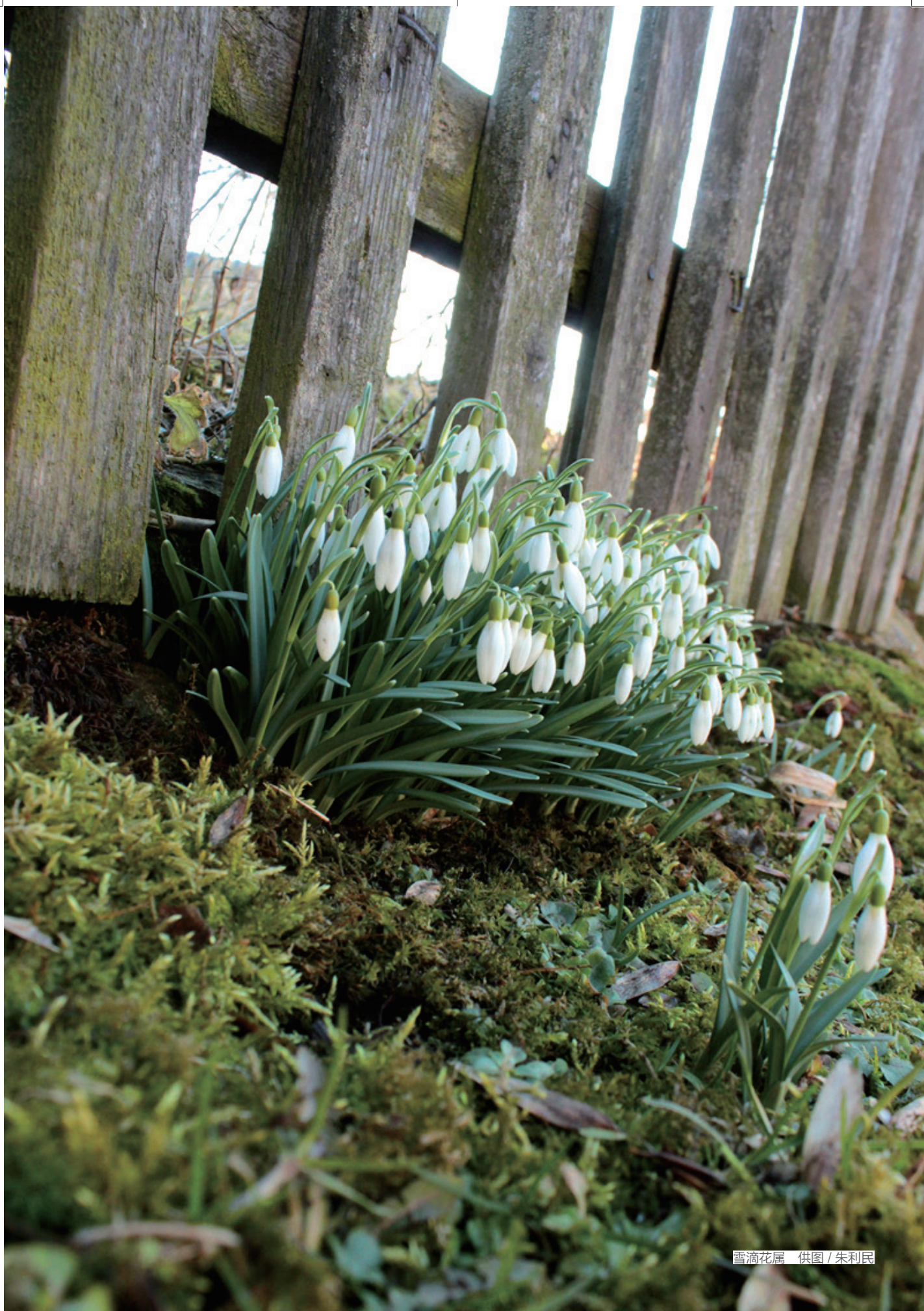
雪滴花属