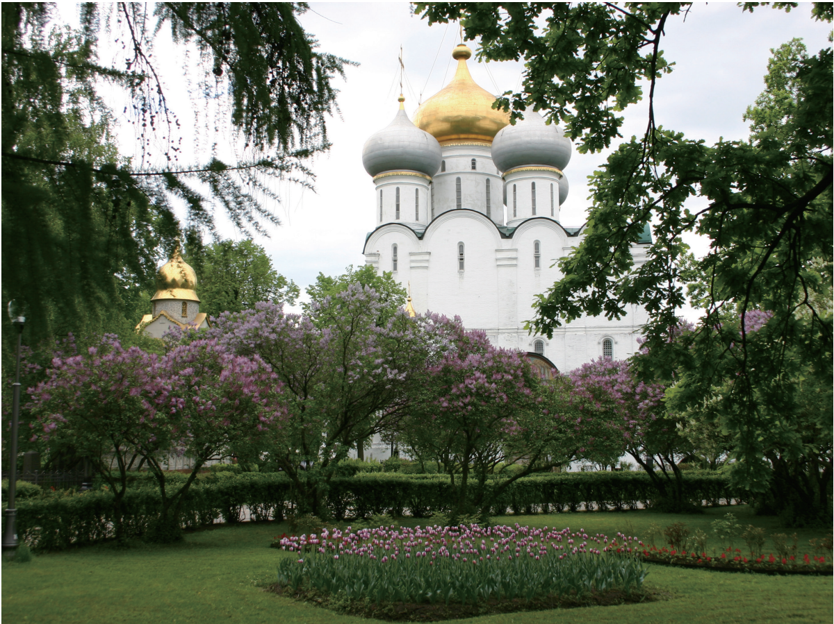
新圣母修道院（女性）前的丁香花