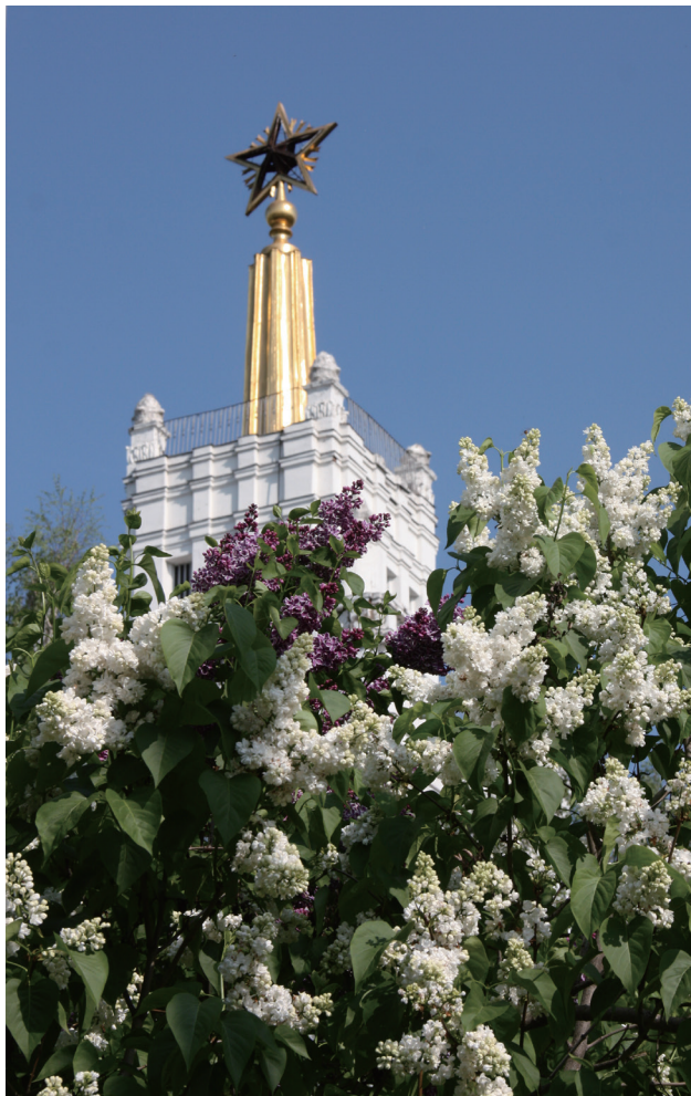
全俄展览中心的丁香景观