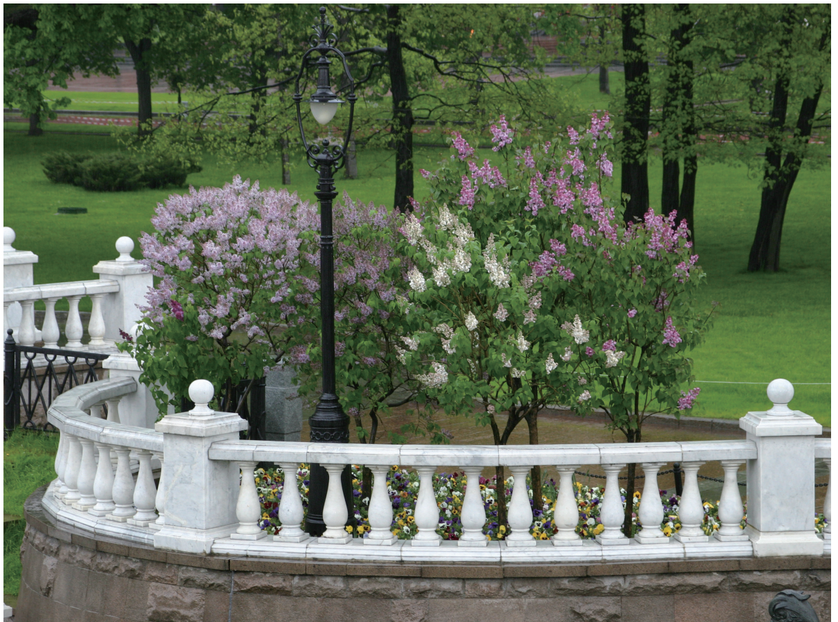
亚历山大公园中的丁香花