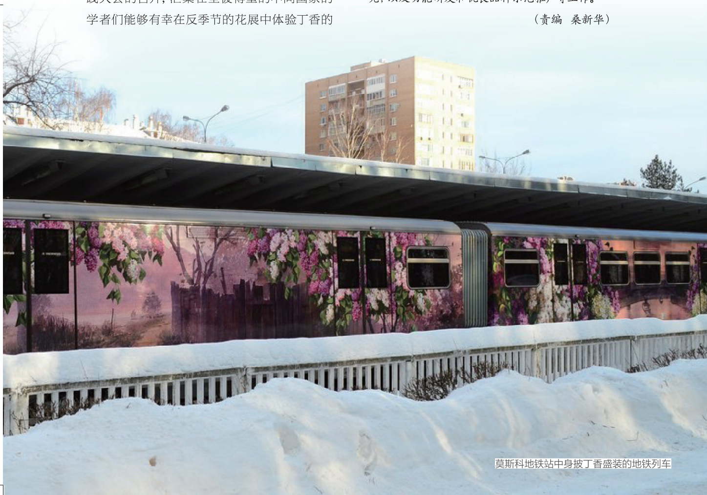
莫斯科地铁站中身披丁香盛装的地铁列车