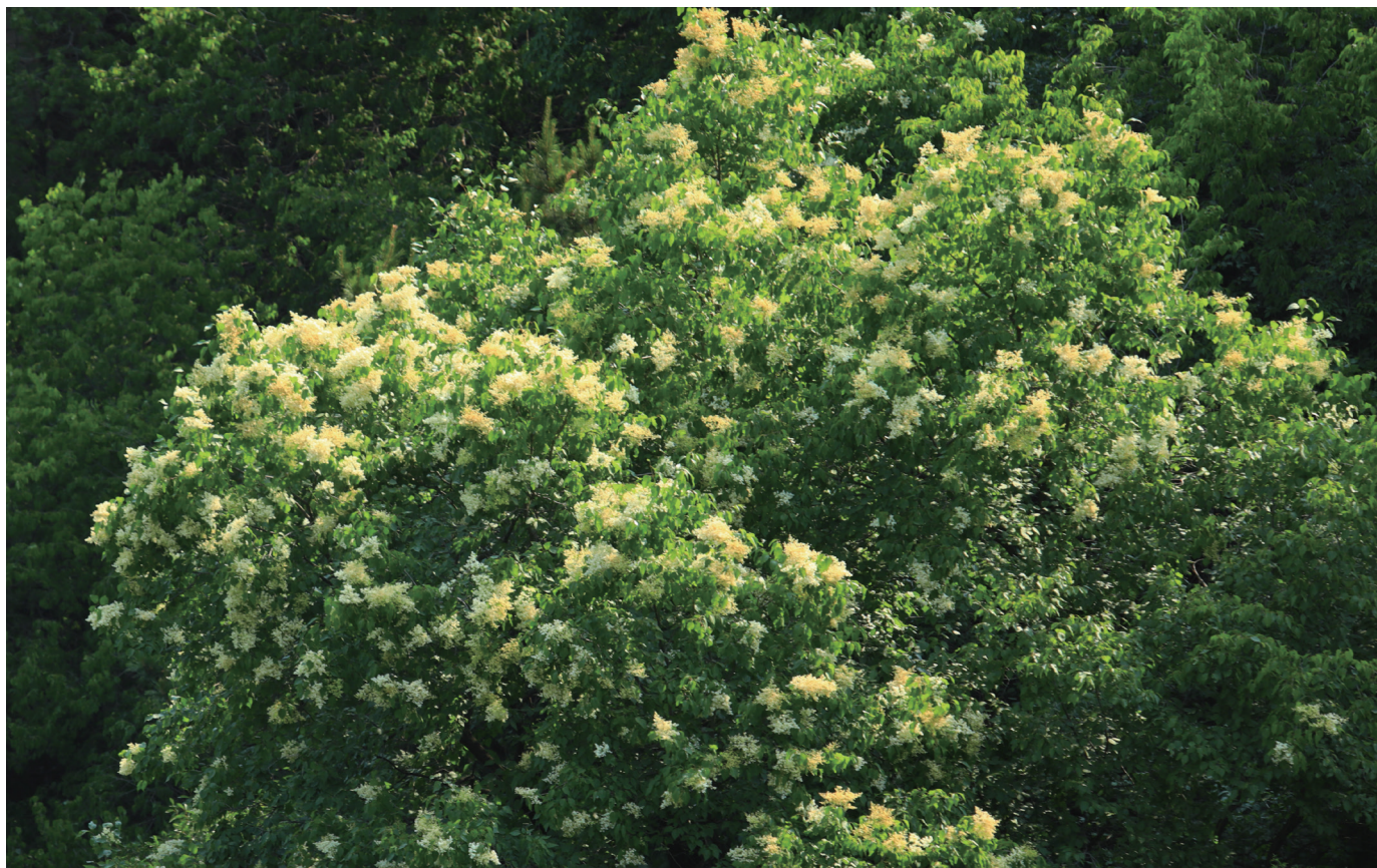
崇山峻岭中盛开的北京丁香