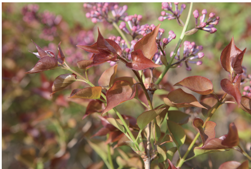
春季红叶的‘瑛霞’