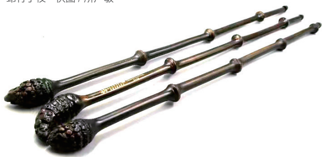
筇竹手杖

筇竹的竿壁特别厚，基部的竿几乎实心，往上才逐渐中空，是做手杖的绝佳材料。中国现存最早的竹谱类著作作为晋代戴凯之的《竹谱》，书中就曾提道：“竹之堪杖，莫尚于筇。”据历史记载，远在汉唐时代，筇竹手杖就远销至印度、中亚乃至欧洲和非洲，在当时已是我国传统的出口商品。