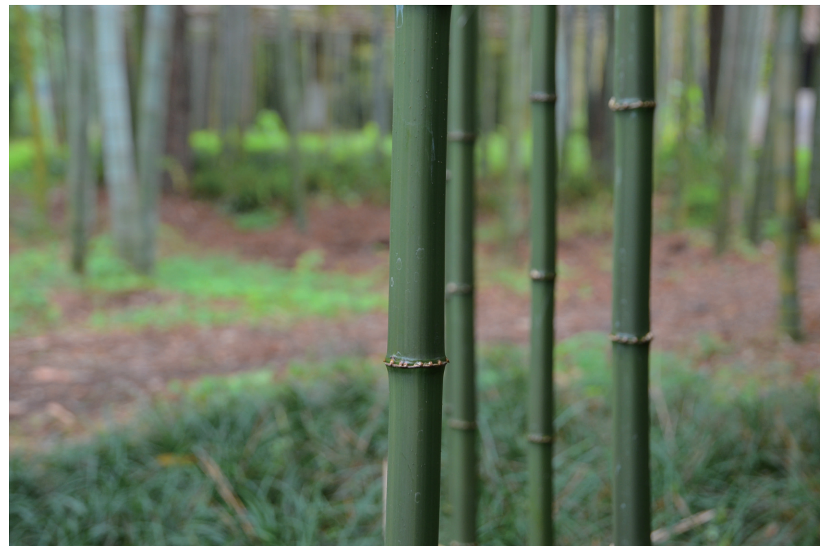
方竹 供图 / 张玲

目前市场上胸径10厘米左右的龟甲竹不超过1000元一株，同规格的圣音竹则需要3000元左右，后者应该是最昂贵的观赏竹了。