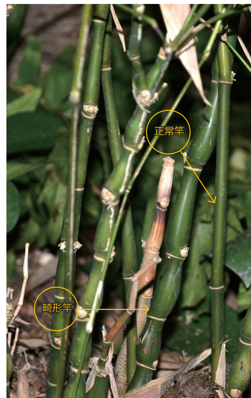
佛肚竹的正常竿和畸形竿