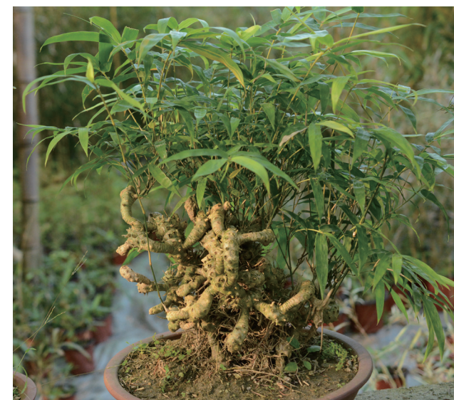
佛肚竹地下茎盆景

常竿多,偶尔也长出少数畸形竿。盆栽时,通过人工截顶、笋期控制水肥、剥竹箨(笋壳)等措施,形成多数畸形竿以供观赏。