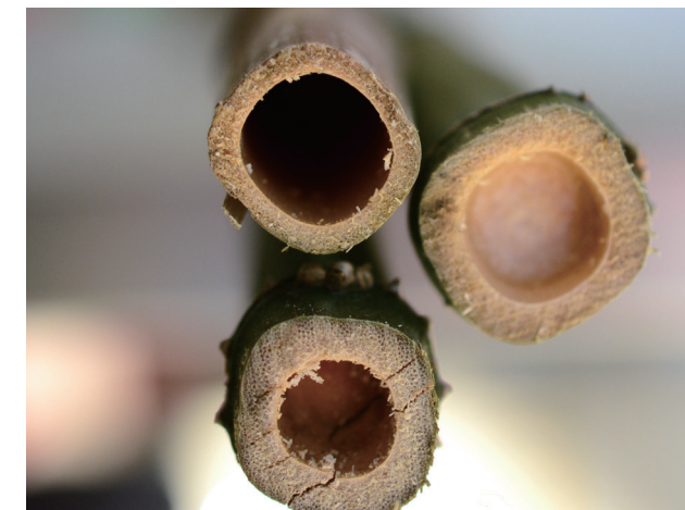
方竹竿横切面