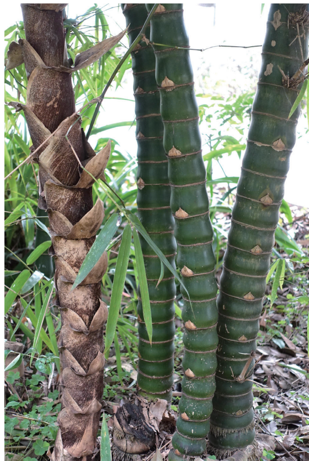
大佛肚竹