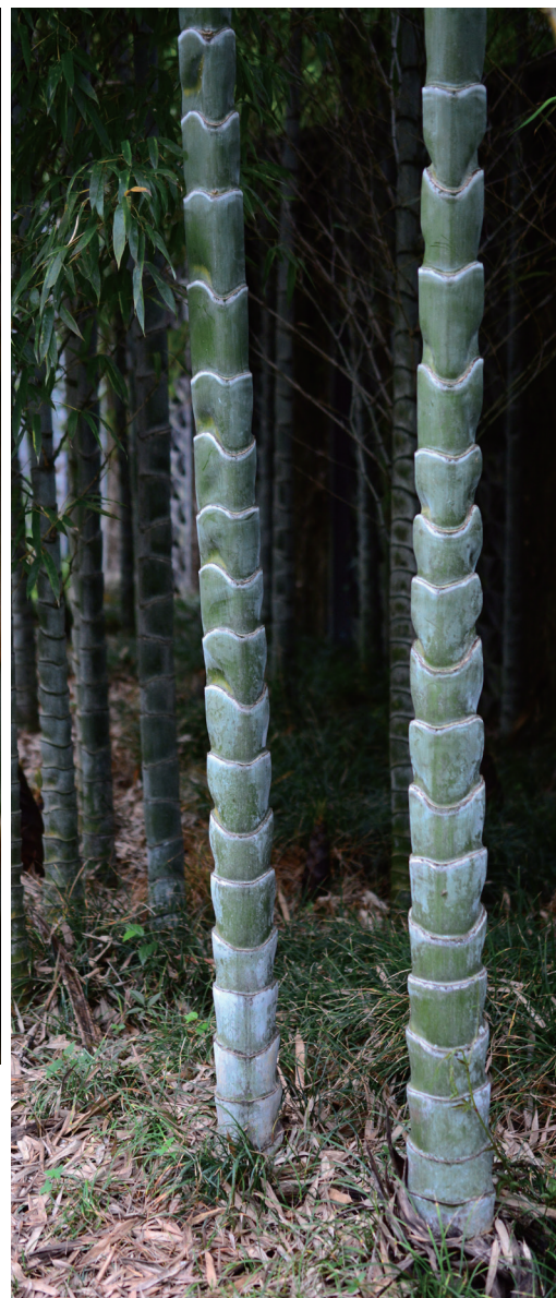
圣音竹 供图 / 张玲

龟甲竹在各地毛竹林中都有零星发现，很少有成片生长的。据说原来经营竹林的群众见到这种竹子就砍掉，因为不能当竹材用。后来被竹子专家发现，如获至宝，经过繁育，成为一种珍贵的观赏竹种。