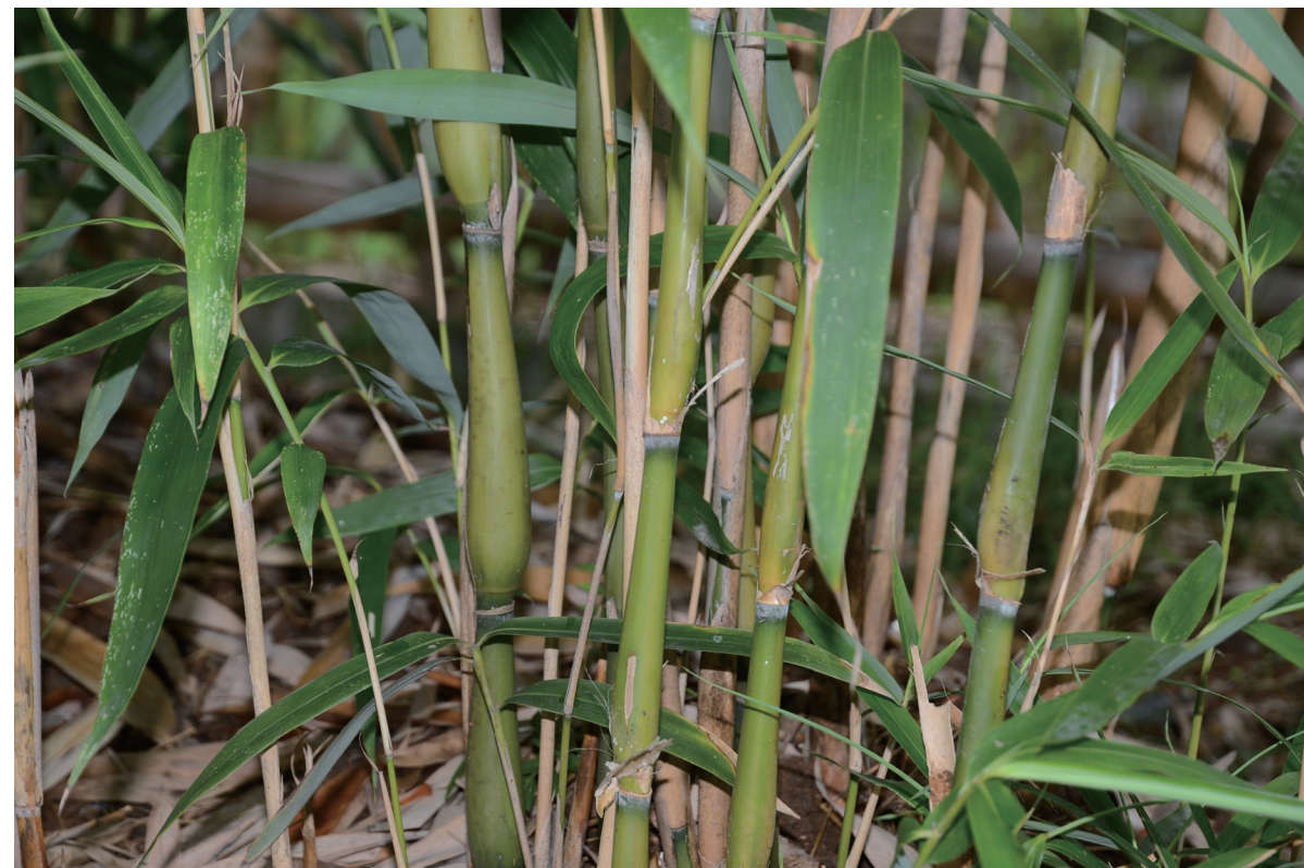
辣韭矢竹

佛肚竹、大佛肚竹、鼓节都是簕竹属的竹子。它们共同的特点是节上的分枝很多, 但都不太耐寒, 在北方只能盆栽, 在室内过冬。